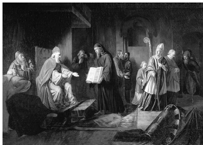
И. Эггинк. Великий князь Владимир избирает религию