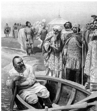
К. Лебедев. Святослав и Цимисхий