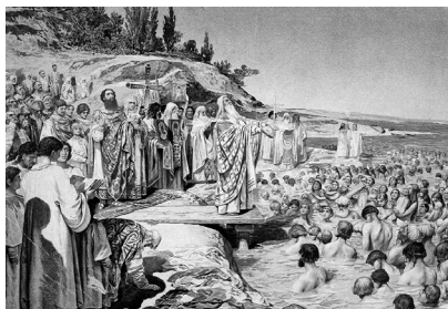
К. Лебедев. Крещение киевлян