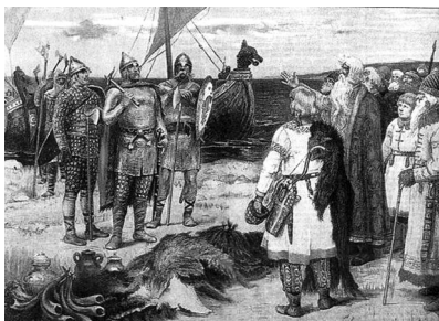
В. Васнецов. Варяги