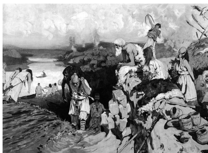
Жильё восточных славян. Художник С. В. Иванов