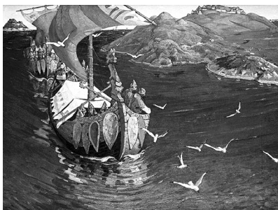
Н. Рерих. Заморские гости