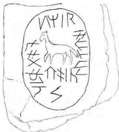
Микоржинский второй камень