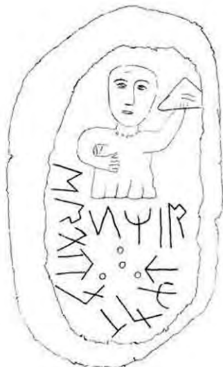
Микоржинский первый камень