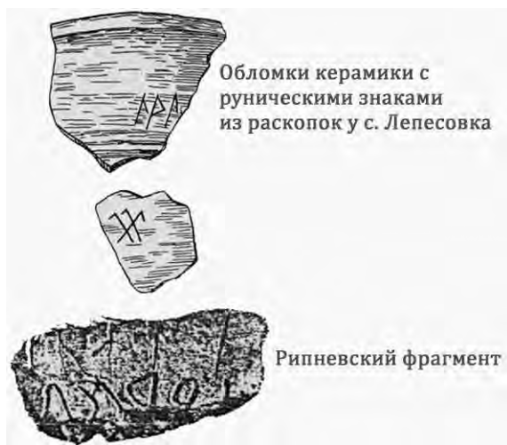
Обломки керамики с руническими знаками из раскопок у с. Лепесовка