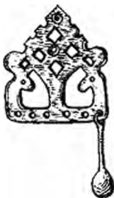
Подвеска-амулетс обозначением символа Земли и небесными оленями.

Поклонялись славяне Роду – Отцу Вездесущему, Сварогу – его сыну, который считался даже ипостасью бога Рода. Сварог научил людей кузнечному делу, работать с металлами, плавить руду. А также Сварог был богом законов. Например, он повелел мужчинам иметь и знать одну жену (женщинам аналогично – одного мужа), детей воспитывать в уважении к старикам и обычаям. Также у наших предков очень почитаемы были такие Боги как Перун, Святовит, Мара, Макошь, Ярила, Лада, Леля, Жива.