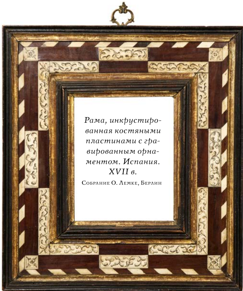
Рама, инкрустированная костяными пластинами с гравированным орнаментом. Испания. XVII в.