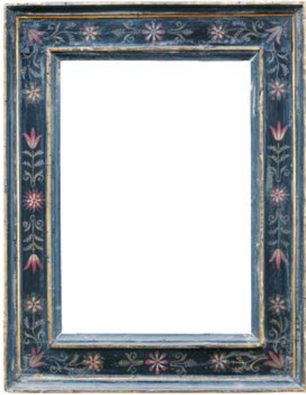
Рама с орнаментом, исполненным красками по чёрному фону. Флоренция. XVII в.