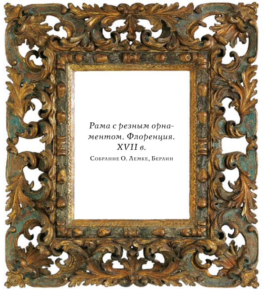
Рама с резным орнаментом. Флоренция. XVII в.