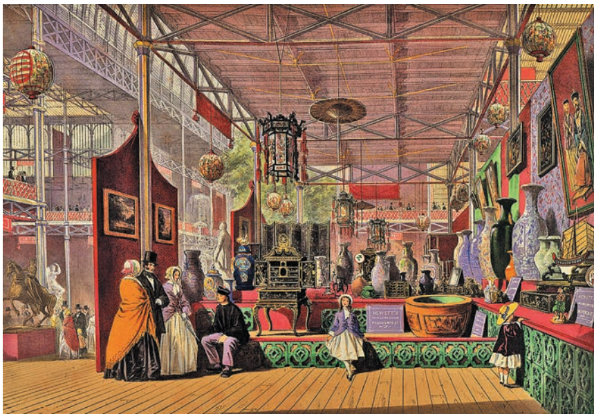
2.1. Китайский отдел на Всемирной выставке 1851 года. Раскрашенная литография из издания « Dickinson's Comprehensive Pictures of the Great Exhibition of 1851 », 1852