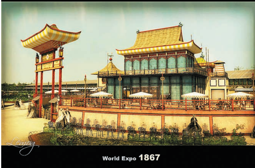
2.3. Л. Антуан. 3D-реконструкция китайского павильона на Парижской всемирной выставке 1867 года.