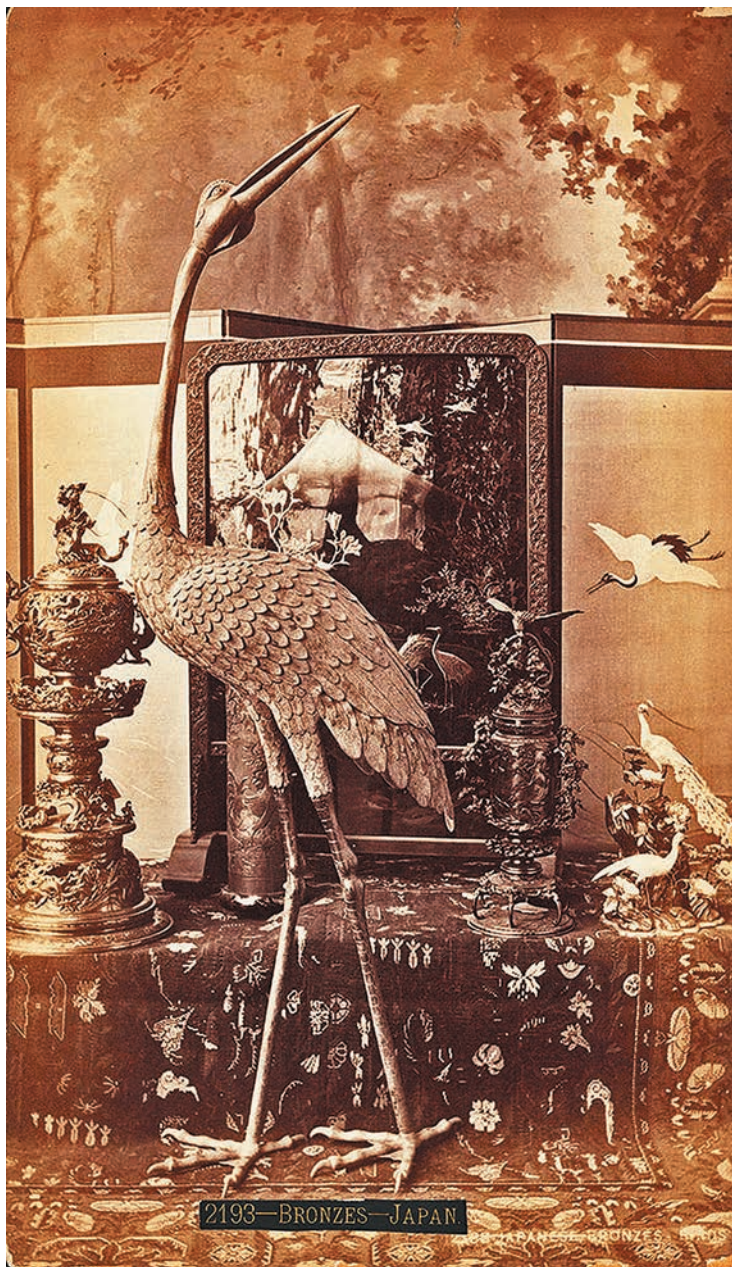
2.6. Японская бронза. Фрагмент стенда на Всемирной выставке в Филадельфии, 1876.

Архивная фотография.