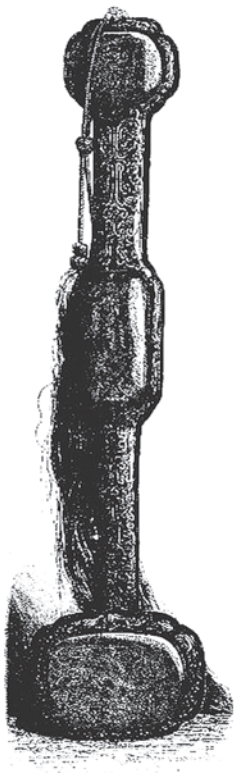
2.4. Китайский скипетр. Нефрит.

Иллюстрация из издания «Les Merveilles de l'Exposition universelle de 1867»