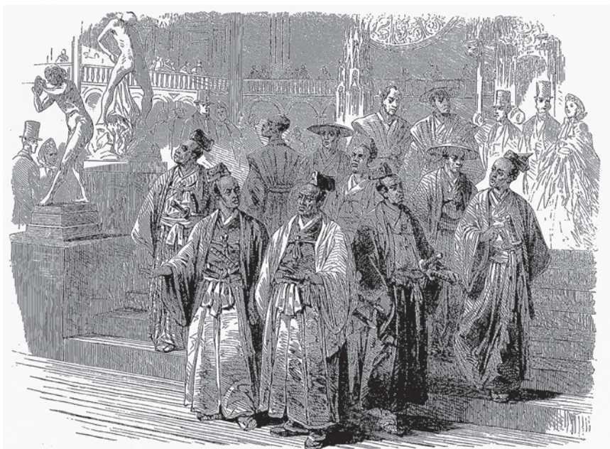
2.2. Члены посольства Японии во время посещения Международной выставки 1862 года в Лондоне. Иллюстрация в газете Illustrated London News . 1862 May 24