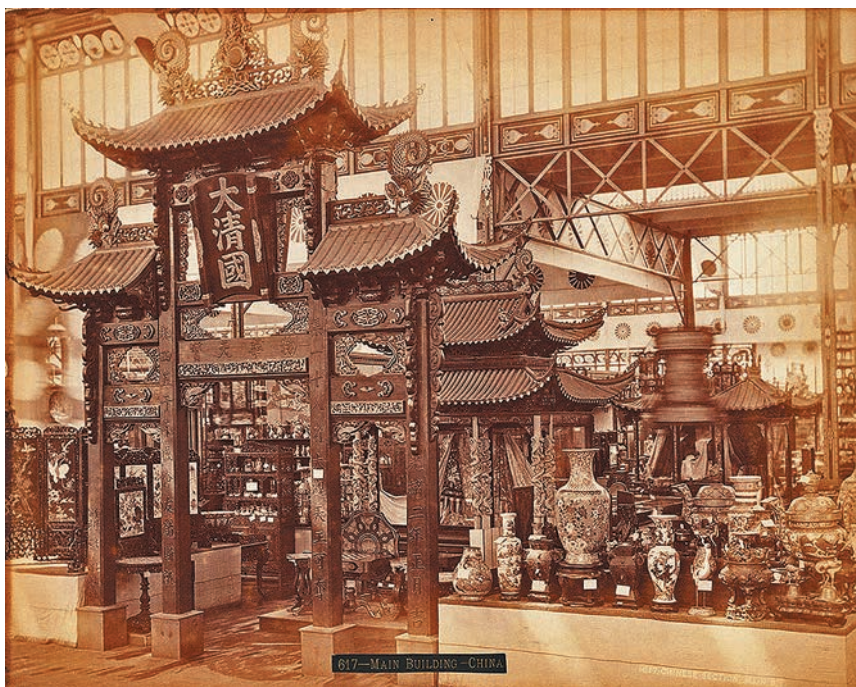
2.7. Стенд Китая на Всемирной выставке в Филадельфии, 1876. Архивная фотография.