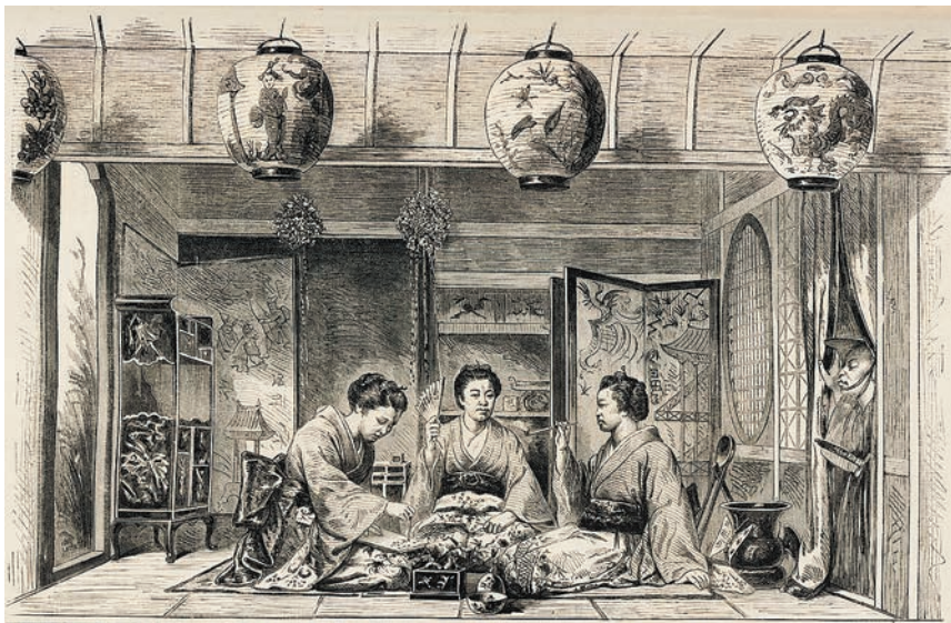
2.5. Япония. Интерьер дома губернатора Сацумы. По рисунку г-на Монтани. Из издания «Le Monde illustré»