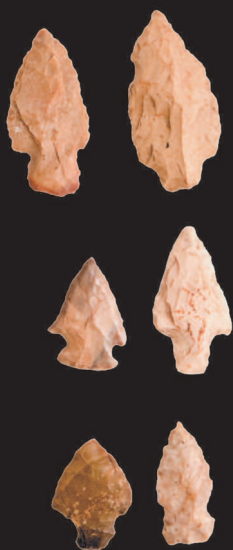
▲ Каменные наконечники стрел

Цветные камни всегда представляли ценность для людей. Правда, это не всегда были ювелирные самоцветы и понимание их ценности в разные времена выглядело совершенно по-разному.