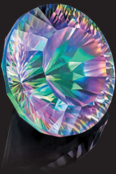
▲ Мистический топаз

Конечно же, с точки зрения современных ученых, астрология — это не наука. Чтобы некая область знания стала наукой в ее современном смысле, постулаты этой области знаний должны быть воспроизводимы. Это значит, что если некий ученый, опираясь на знания из указанной научной области, провел некий эксперимент, то результаты этого эксперимента должны быть одинаковыми у любого другого ученого в мире, вне зависимости от места проведения эксперимента и личности экспериментатора. То есть если взять