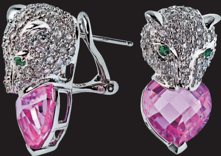
◀ Серьги с синтетическими розовыми корундами