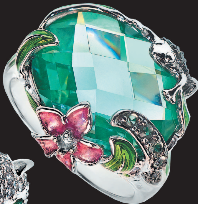
▲ Кольцо с синтетической зеленой шпинелью

К концу XX — началу XXI в. люди уже знали и использовали столько ювелирных цветных камней, сколько не было известно за все 10 000 лет истории человечества.