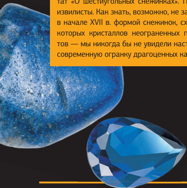
◀ Два камня, в разное время называвшиеся сапфиром: ляпис-лазурит (слева) и сапфир (синий корунд) (справа)

В основе кристаллографии лежит работа немецкого астронома и математика И. Кеплера, изданная в 1611 г. — трактат «О шестиугольных снежинках». Пути истории крайне извилисты. Как знать, возможно, не заинтересулся Кеплер в начале XVII в. формой снежинок, сходной с формой некоторых кристаллов неограниченных природных самоцветов — мы никогда бы не увидели настолько совершенную современную огранку драгоценных камней.