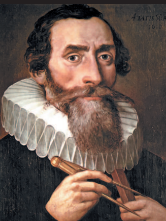
◀ Иоганн Кеплер

Сочетания этих трех качеств самоцветов люди начали исследовать очень давно. Технология обработки драгоценных камней развивалась столетиями и достигла современных высот только к началу XX в. Сложность обработки самоцветов обусловлена их твердостью, а также множеством законов физики и кристаллографии, которые необходимо учитывать при огранке камня. И если физика как наука возникла благодаря древнегреческому ученому-философу Аристотелю уже в IV в. до н.э., то кристаллография — это относительно молодая область знаний.