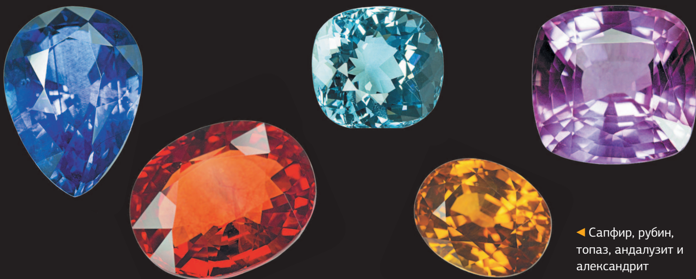
◀ Сапфир, рубин, топаз, андалузит и александрит

Ближе к XVI в. самой ценной ювелирной драгоценностью стал жемчуг. Индийские жемчужины, добываемые в Персидском заливе, служили для демонстрации богатства