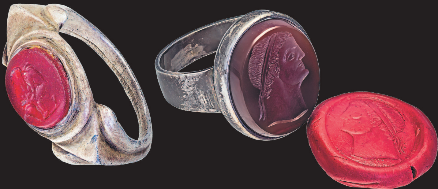
▲ Кольцо с инталией в римском стиле. Серебро. Сердолик