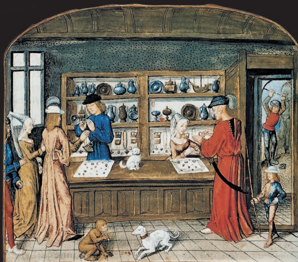
▲ Ювелирный магазин. Франция. Миниатюра XV в.

Кроме того, мир современных драгоценных самоцветов, и мир тех камней, которые считались драгоценными в давно минувшие дни, разительно отличаются. Даже названия старинных самоцветов никак не пересекаются с сегодняшними наименованиями. Вряд ли наш современник без специального образования сможет объяснить разницу между, скажем, драгоценным карбункулом, яхонтом, лалом и венисой. Старинные названия камней, прошедшие сквозь века, в наше время полностью поменяли смысл. Например, тот самоцвет, который четыре тысячи лет назад называли сапфиром, сейчас стал ляпис-лазурью или лазуритом. Изумрудом или смарагдом считали, скорее всего, современный хризолит.