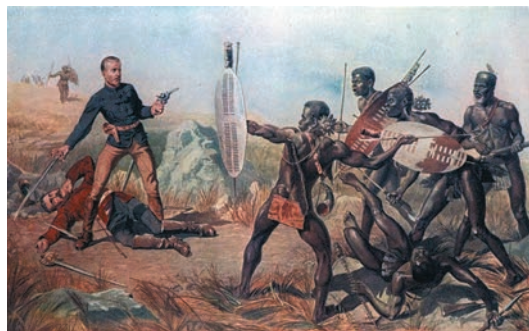
Англо-зулусская война (1879 г.) между Великобританией и племенами зулусов в Африке – яркий пример колониальной войны

Самой длинной войной считается Реконкиста – борьба христианского населения Пиренейского полуострова – испанцев и португальцев – против захвативших его мавров-мусульман. Эта война началась в середине VIII в. и длилась более 700 лет.