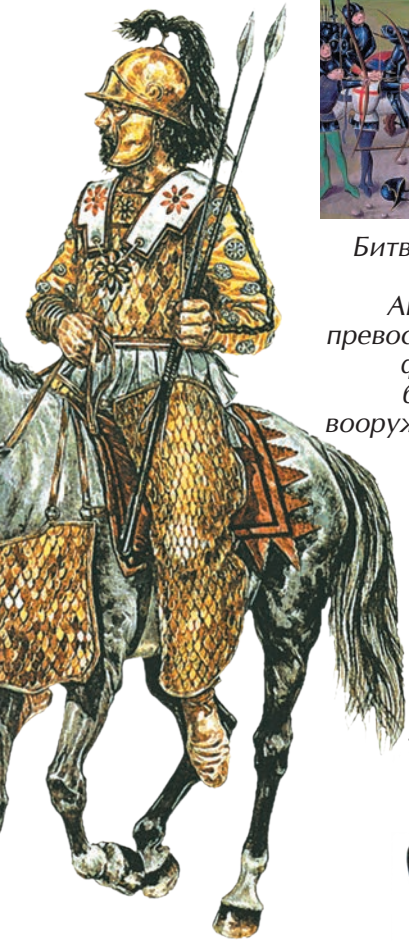
Воин в доспехах