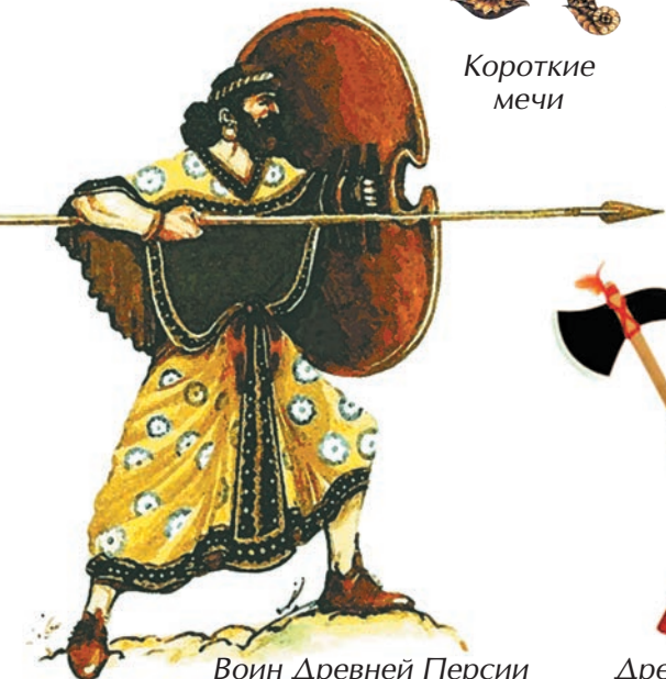
Воин Древней Персии