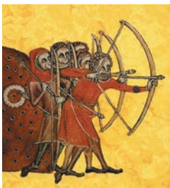
Тренировка галльских лучников (миниатюра XIV в.)