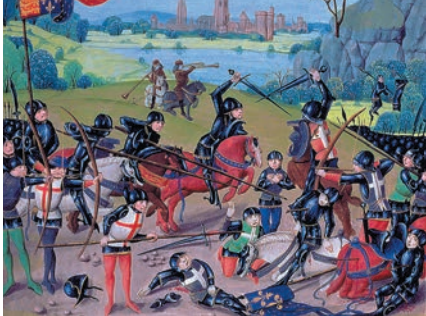
Битва при Азенкуре, 1415 г. (миниатюра XV в.). Англичане разгромили превосходящую по численности французскую армию благодаря стрелкам, вооружённым длинными луками