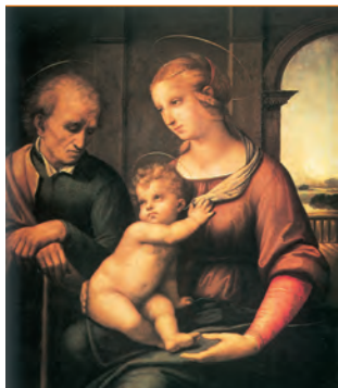
Святое семейство. Рафаэль Санти (Эрмитаж)

широкие курдонеры (почетные дворы, отделенные оградой). Северный фасад, обращенный к Неве, наиболее торжествен: исследователи насчитали здесь 12 типов оконных проемов и 22 варианта их обрамления. Нынешний бело-зеленый цвет дворец получил в нач. XX в. – до того он имел сначала желтую, а затем красновато-оранжевую окраску. Главная анфилада залов тянулась вдоль невского фасада. Интерьеры многократно перестраивались – особенно значительные изменения произошли после разрушительного пожара 1837 г.