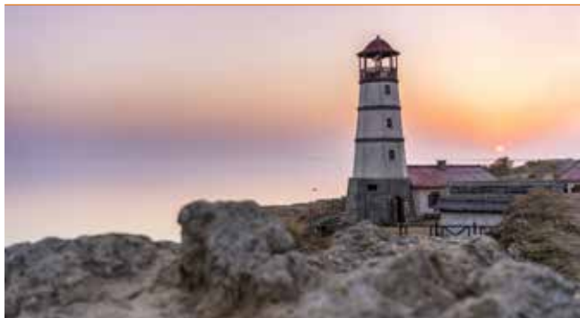
«Маяк» в хуторе Мержаново

которая разработала для ростовского этапа маршрута тематическую экскурсию «Азовские походы Петра. Начало» (Ростов-на-Дону, просп. Кировский, 35, 2-й эт., ☎ +7 (863) 237-55-99, anyticket.travel ).