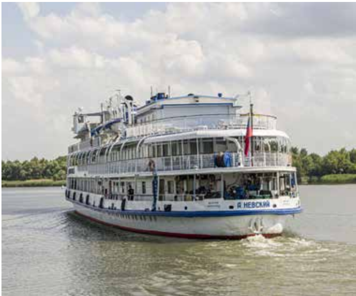
Круизный теплоход «Александр Невский» на Дону

• Пригородный автовокзал , пр. Шолохова, 126, ☎ +7 (863) 251-08-67, www.donavto.ru/