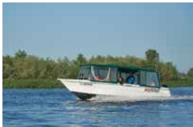
Прогулка на катере по Таганрогскому заливу

ЛАЙФХАК. Тем, кто не готов к самостоятельному путешествию или хочет получить сопровождающего на начальном этапе маршрута, рекомендуем обратиться в ростовское отделение компании AnyTicket ,