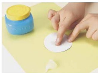
Сначала капните немного клея, а затем попросите ребёнка пальчиком распределить его по поверхности детали