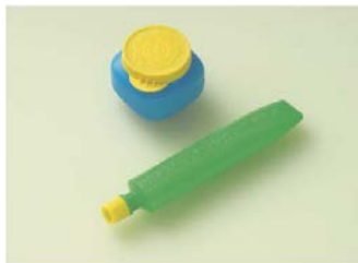
Выберите клей, безопасный для ребёнка

Детали нужно приклеивать на специальные области, на которых написано «клей». Поначалу обращайтесь на них внимание ребёнка. Например, проговаривайте: «Эту деталь нужно приклеить вот сюда».