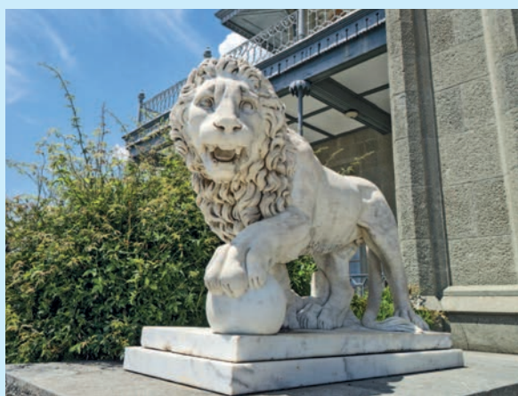
Лев, охраняющий вход в замок

Богатством и красотой поражает внутреннее убранство дворца: каминные из кар-