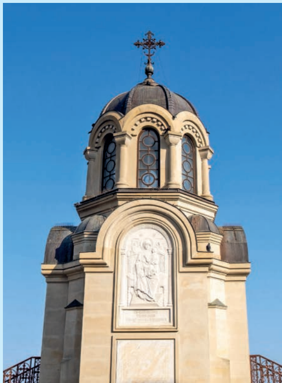
Часовня новомучеников и исповедников российских

Сегодня здесь бьется курортное сердце Ялты и всего Южного берега Крыма. Яркими витринами называют бутики, рестораны соревнуются за лучший вид, самый вкусный кофе и притязательную кухню. Здесь можно увидеть множество памятных исторических мест и достопримечательностей. Например, старинный маяк, который освещает путь морякам более 100 лет. У кромки