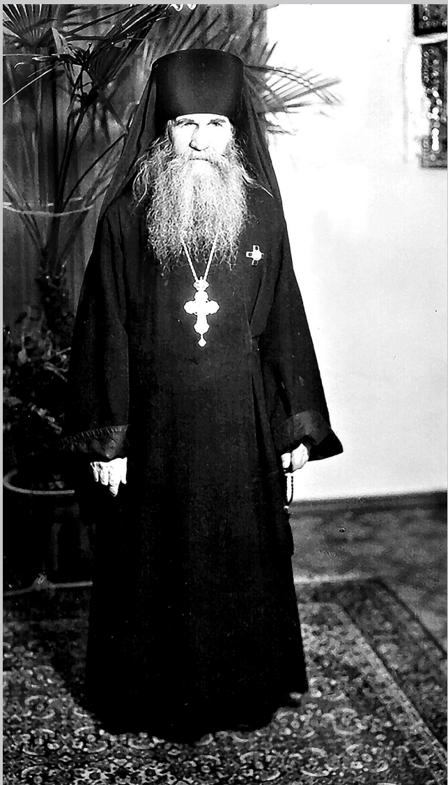
Архимандрит Иероним (Тихомиров)