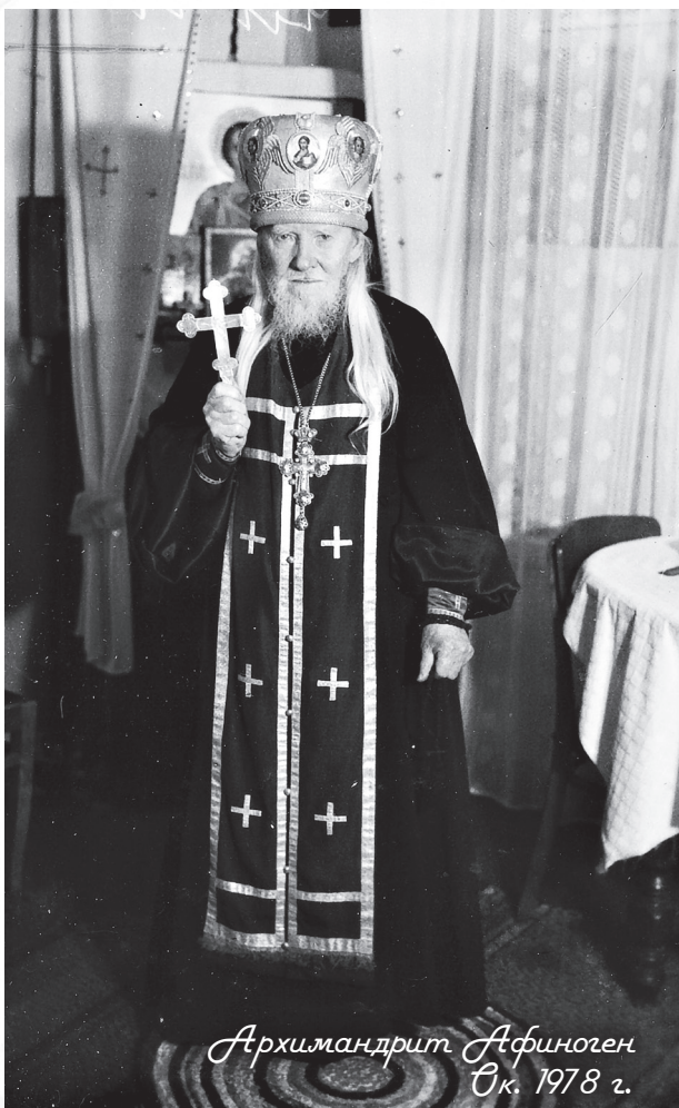
Архимандрит Афиноген Ск. 1978 г.