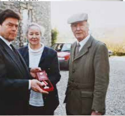
Посол РФ в Великобритании Б.Д. Панкин вручает орден родителям Рори в Лондондерри