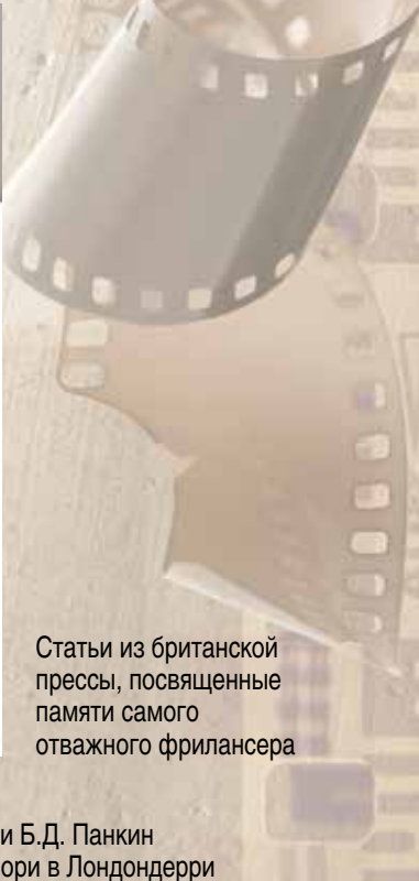
Статьи из британской прессы, посвященные памяти самого отважного фрилансера