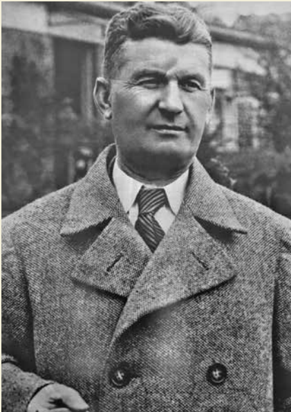
Томаш Батя придумал и реализовал проект капитализма с человеческим лицом