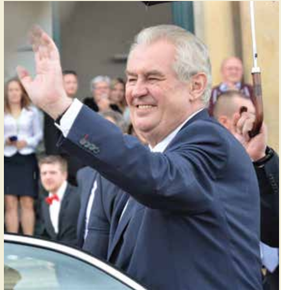
Милош Земан — самый непредсказуемый президент Евросоюза