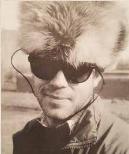
Рори Пек был убит в октябре 1993-го, когда снимал штурм телецентра Останкино

одного основ- ящихся слут- тормо- лезался завле- ная, т про- агиро- ть. Это жизни дама