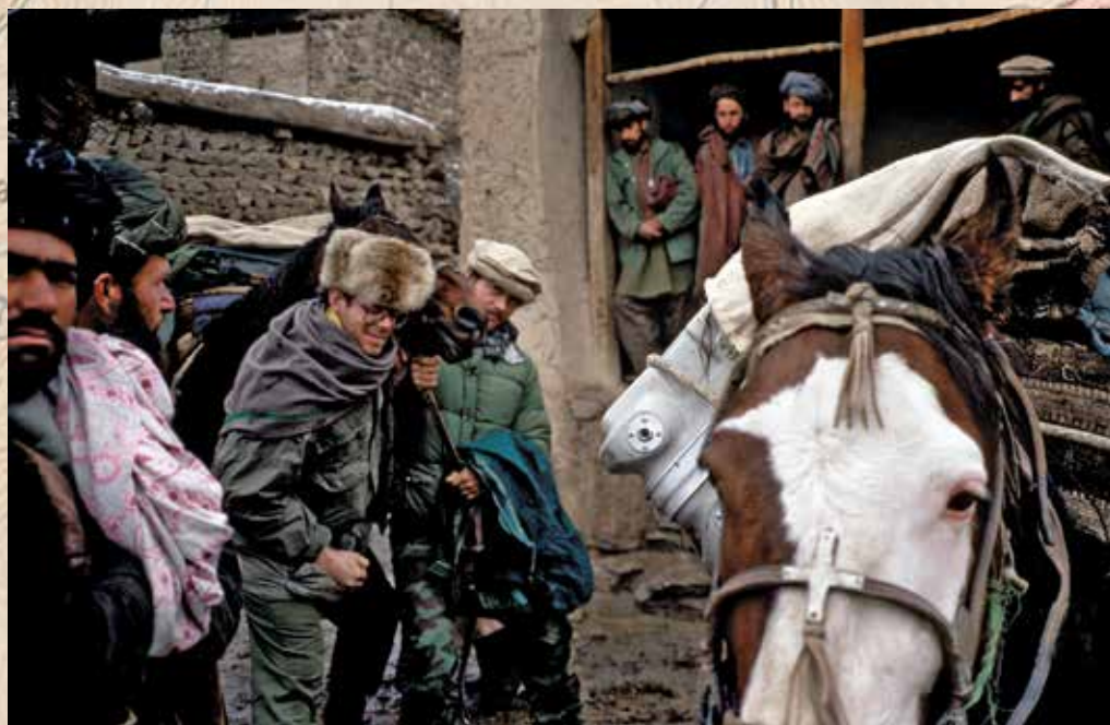
Выбираем лошадей перед тем, как идти через заснеженные перевалы