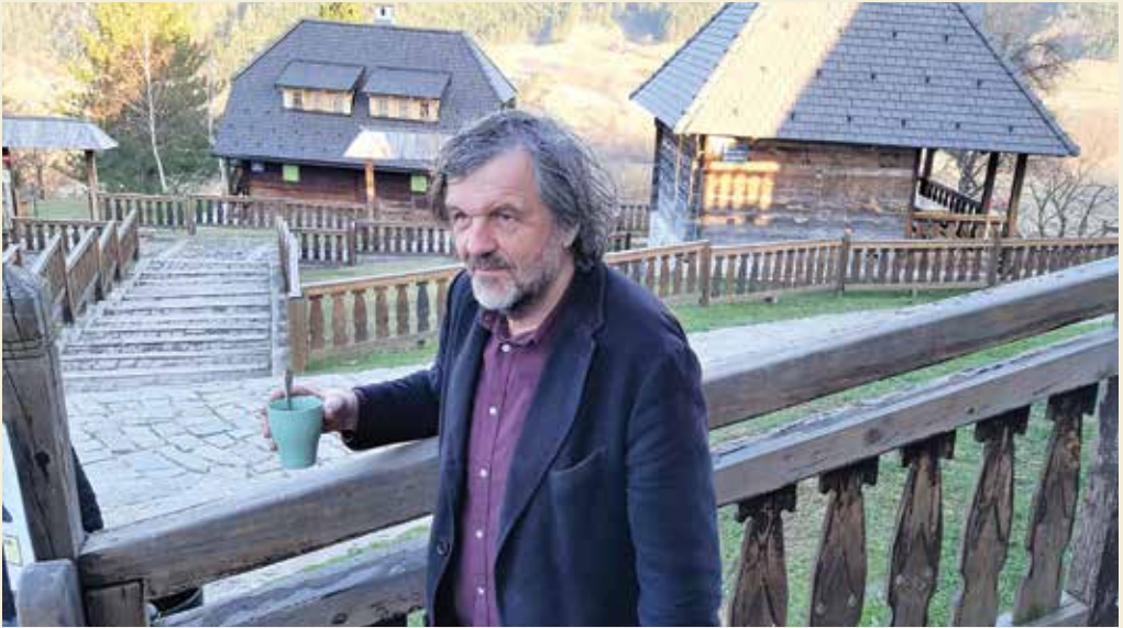
Кустирица и его любимое место на земле — построенная по проекту Эмира и на его деньги этнодеревня Дрвеноград. В ней все деревянное: дома, тротуары, часовни, ресторанчики, сувенирные лавки