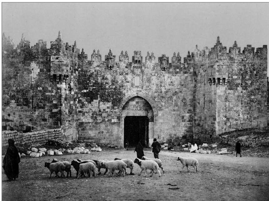
Дамасские ворота Старого Иерусалима. Открытка 1900 года

и большую часть ночи посвящал он неустанному напряженному труду. Двери его келии с раннего утра до позднего вечера не закрывались: рано утром он принимал туземцев-арабов, решая их споры, давая полезные советы, оказывая им материальную помощь предметами первой необходимости и деньгами; их сменяли учителя и учительницы основанных им школ, члены Миссии, испрашивая его советов и распоряжений; в каждую минуту свободно и доверчиво шли к нему русские паломники — сановники, купцы и крестьяне, богатые и бедные, стараясь найти у него разрешение волновавших их недоуменных вопросов. И отец Антонин охотно и подолгу беседовал с каждым, чем успел многих из них привлечь на свою сторону и расположить