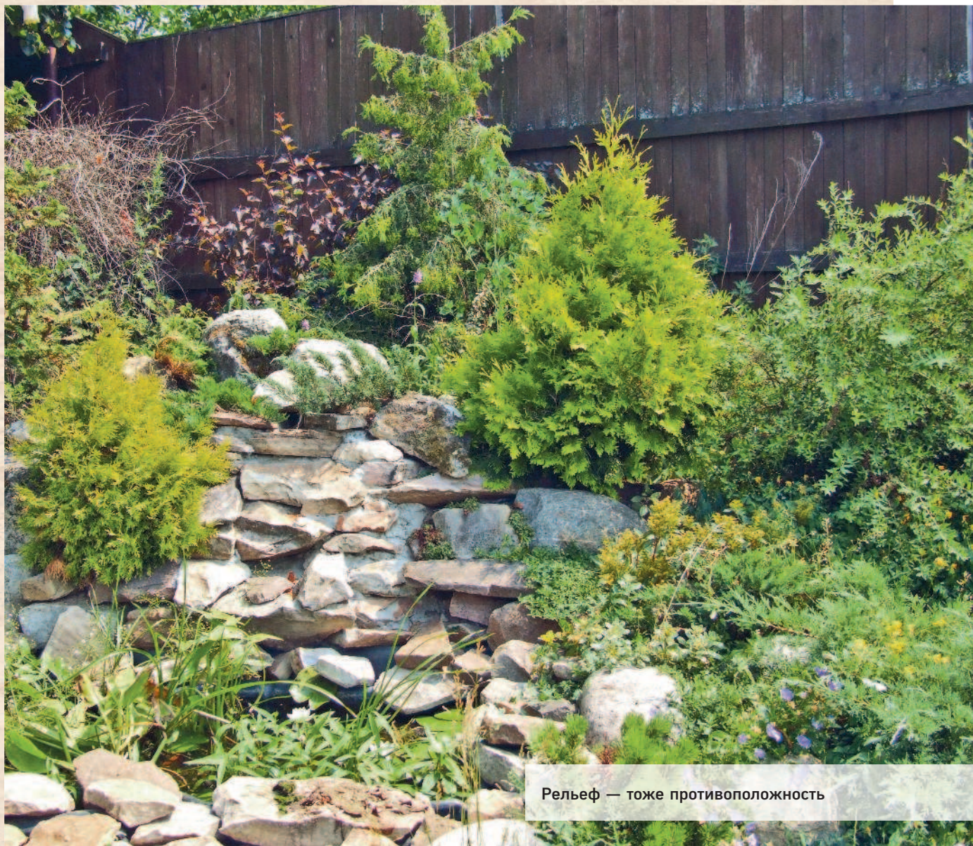
Рельеф — тоже противоположность