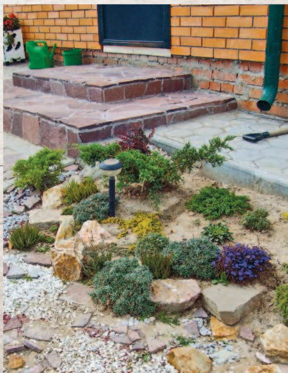
В методе противоположного оформления нужно противопоставить форме сада

он будет не квадратом, а ромбом, и т. д. Классический прямоугольник или квадрат — это слишком конкретно. Вам нужно исказить форму, сделать так, чтобы глаз двигался медленнее, следуя за линиями. Вместо прямоугольной площадки отдыха соорудите угловую, дорожку расположите по диагонали и т. д.