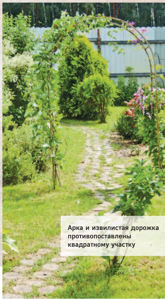
Арка и извилистая дорожка противопоставлены квадратному участку