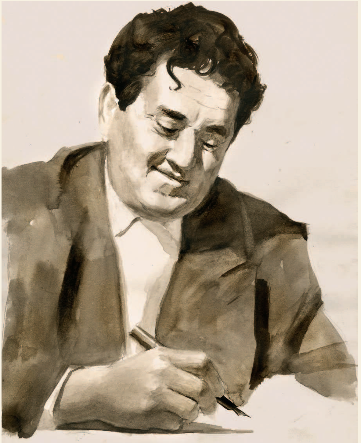
Виктор Юзефович ДРАГУНСКИЙ 1913–1972