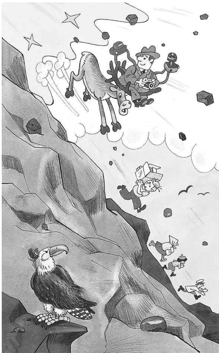
Рисунки Вячеслава Полухина