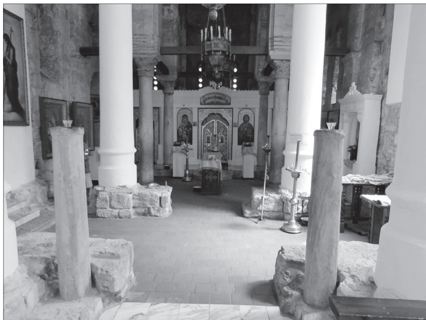
Две колонны притвора церкви Святого Иоанна Предтечи в Керчи на переднем плане

Выдающаяся роль Филона Александрийского как раз и заключается в том, что ему удалось осуществить синтез высшего иудейского разумения Бога Живого с абстрактным понятием эллинской премудрости об «идее идей», отраженным в творении Вселенной, но сущем как бы в обезличенном отвлеченном виде в далеком божественном эмпирее. То есть, безусловно, провиденциальным образом Логос в философии Филона Александрийского, впитав в себя ветхозаветное откровение, становится живым, но несет в себе еще потаенное и несколько затемненное дионисийское начало. Возможно, Филон Александрийский, вплотную приблизившись к тайне всего сущего, был потрясен от изумления, а потому иногда изображал Логос в весьма размытых тонах, что, впрочем, могло происходить не по умыслу автора, а из-за недостатка средств выражения в современном ему александрийском эл-