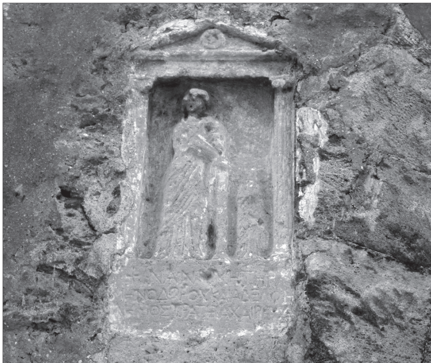
Внешнее убранство храма в Керчи, напоминающее сюжеты из античных мистерий

мировоззрения, краеугольным камнем которого становится догматическое учение о Святой Троице и Логосе, ведь именно к V столетию завершись в церковной ограде ожесточенные споры тринитариев с антитринитариями, и очень знаменательно, что символическую точку здесь поставил один из последних схолархов Платоновой Академии в Афинах и приверженец персидско-халдейского тринитарного монотеизма, о чем мы писали ранее, Прокл Диадох. Иными словами, два философа, александрийский эллинистический иудей и эллинский традиционалист из Афин с «халдейским» мировосприятием, с внешних сторон как бы спаяли собой христианство, с тех пор дошедшее до нас практически неизменным, особенно в виде греко-византийской ортодоксии.