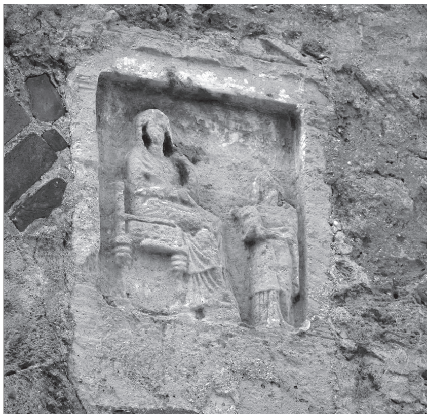
Внешнее убранство церкви Святого Иоанна Предтечи в Керчи. Пластика по камню сродни стилю изображения античных мистерий

В череде античных философов и писателей, изученных неумолимым эллинистом XX столетия, выделяются именно эти двое, не сумевшие переступить порог христианского святилища и оставшиеся неподвижными колоннами в его притворе. И, что характерно, молва и предание прочно связывают каменные колонны керченской церкви Святого Иоанна Предтечи – кстати, последнего пророка Ветхого Завета, – с императором Юстинианом Великим, который в подражание царственному зодчему Соломону воздвиг Собор Святой Софии в Константинополе и, проникшись великолепием своего творения, вос-