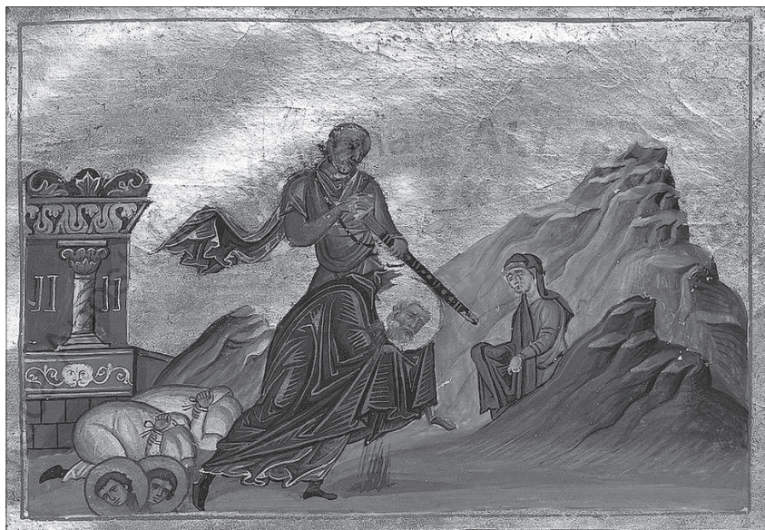
Мученичество святых Дионисия Ареопагита, пресвитера Рустика и диакона Елевферия. Миниатюра из Минология Василия II

совещании высказался за сохранение Иерусалимского храма, и его поддержал еврей по роду и племени Тиберий Юлий Александр; тогда как фрагмент Тацита, сохранившийся в хронике Сульпиция Севера, сообщает об обратном: Тит настаивал на разрушении храмового комплекса Святого Града, чему вторил и Тиберий Юлий Александр. Здесь, как выясняется, перед нами возникает древняя проблема гения и злодейства (которой зачастую сопутствовал и адюльтер или покушение на него), в иудейской традиции сопряженная с кровными узами: Давид – Авессалом, Филон – Тиберий Юлий Александр; она великолепно отображена в «маленькой трагедии» А.С. Пушкина «Моцарт и Сальери». Считается, что описанная Иосифом Флавием Иудейская война была первым холокостом в истории еврейского народа, потерявшего тогда около 500 000 своих сыновей и дочерей. После катастрофы 70-х гг. новой эры Тиберий Юлий Александр продолжал пребывать на