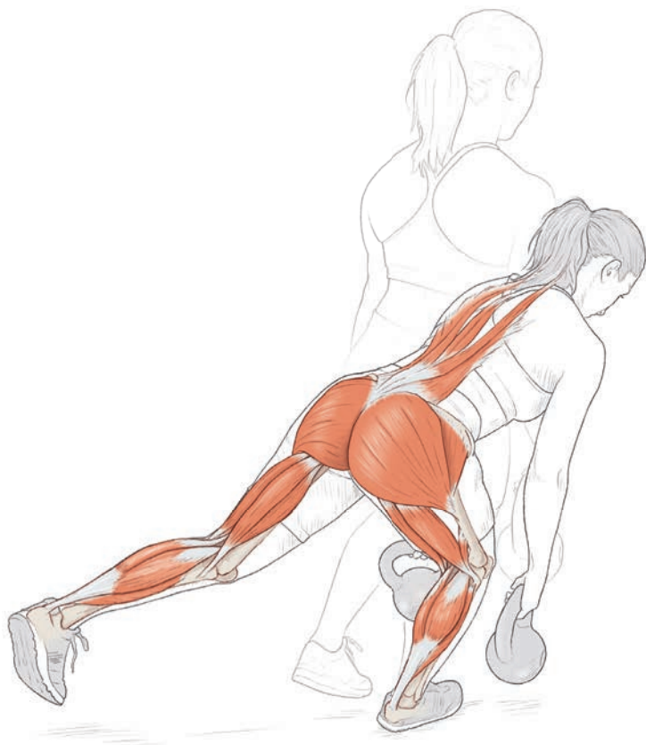
Рисунок 1.2. Во время выполнения становой тяги на одной ноге средняя ягодичная мышца, приводящие мышцы бедра и косая мышца живота работают для стабилизации таза и бедренной кости во фронтальной и горизонтальной плоскостях, тогда как задняя группа мышц бедра, большая ягодичная мышца и мышца, выпрямляющая позвоночник, работают в качестве основных мышц-двигателей в сагиттальной плоскости

Рассмотрим пример становой тяги на одной ноге (см. рис. 1.2). Несмотря на то что движение в тазобедренном и коленном суставах осуществляется преимущественно в сагиттальной плоскости, асимметричная природа упражнений для одной стороны тела заставляет мышцы-стабилизаторы позвоночника, таза, бедренной и берцовой костей, а также стопы контролировать положение сустава, осанку и равновесие.