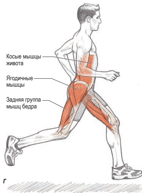
Рисунок 1.3. Шаговый цикл бега, иллюстрирующий функцию задней группы мышц бедра, ягодичных мышц и косых мышц живота: а) начальный контакт; б) фаза опоры; в) фаза толчка; г) фаза переноса ноги