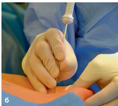
Рис. 1.1. (а) Кончик иглы Вереша. Внутренняя тупоконечная часть снабжена пружиной, за счет чего после прохождения иглой структур брюшной стенки и вхождения в брюшную полость выдвигается обратно. (б) Установка иглы Вереша. Для безопасного проведения иглу фиксируют. Показатель внутрибрюшного давления в начале инсуффляции должен составлять менее 10 мм рт.ст.

Чаще всего иглу Вереша проводят через пупок, поскольку в нем отсутствуют мышцы или жировая клетчатка между кожей и брюшиной. Пупочная грыжа является противопоказанием к использованию пупка для вхождения иглой Вереша в брюшную полость. При наличии рубцов после ранее перенесенных операций иглу Вереша лучше проводить на некотором от них удалении, обычно это расстояние 6 см. В зависимости от предпочтений хи-