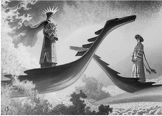
Аврора на картине художника Б. Ольшанского «У небесного причала»

АВСЕНЬ м. — первый день весны, 1 марта, коим прежде начинался год; ныне название это перенесено на Новый год и на Васильев вечер, канун Нового года. В песнях: тусень, титусень, туа-сень, таусель; щедрованье или обсев хозяина житом, с пожеланьями; свиная голова к обеду; вечером гаданья.