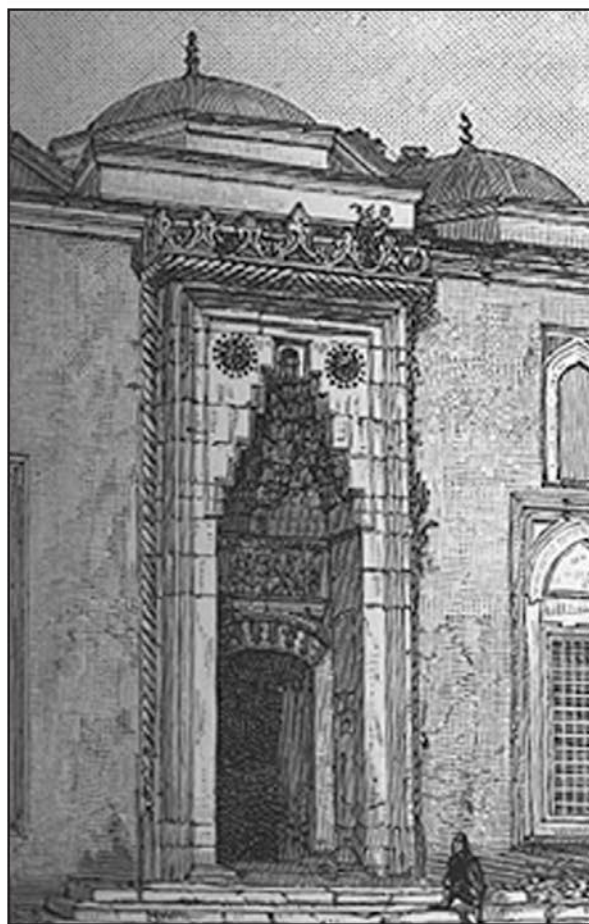
Мечеть Баязида XII

В нашей полуразрушенной кофейне ими управляет армянин — мим, комедиант и искусный кукловод. Его профессия стара; где только он не побывал! В Венгрии от его шуточек хохотали целые гарнизоны, в Египте им улыбался могущественный паша; он возил своих кукол,