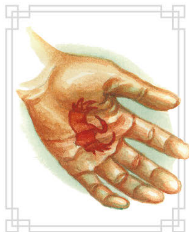
Ладонь Ранда с клеймом в виде цапли

Влияние этого Кружева эпох распространяется не только на сам физический мир и его основы, но также и на другие миры и вселенные, на другие измерения, на другие возможности. Колесо воздействует и на то, что может быть, и на то, что могло бы быть, и на то, что есть. Оно влияет на мир снов в той же мере, что и на мир яви.