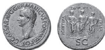
Сестерций времен правления Калигулы с портретом его сестер на реверсе: слева Агриппина, Друзилла в центре и Ливилла справа.

В Древнем Риме после смерти императора сенат обычно прославлял имя усопшего и даровал ему божественный статус с соответствующими почестями, но если императора презирали или ненавидели, то сенат мог поступить с точностью до наоборот — проклясть его, а не обожествить. Это и есть damnatio memoriae , что означает «осуждение памяти» (современный термин). Без колебаний и церемоний имя императора удалялось из документов и публичных надписей (этот процесс известен как abolitio nominis ), его лицо соскабливали с фресок, посвященные ему статуи разбивались. Порой даже переплавлялись монеты с его изображением. Осужденному императору не только отказывали в восхождении на небеса, но и вычеркивали из истории. Такова была участь порочных, непопулярных или неудачливых правителей.