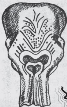
БАРАБАН череп мамонта, Межиричи