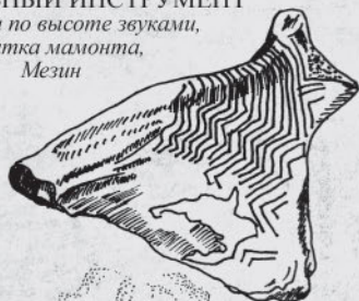
МУЗЫКАЛЬНЫЙ ИНСТРУМЕНТ с разными по высоте звуками, лопатка мамонта, Мезин