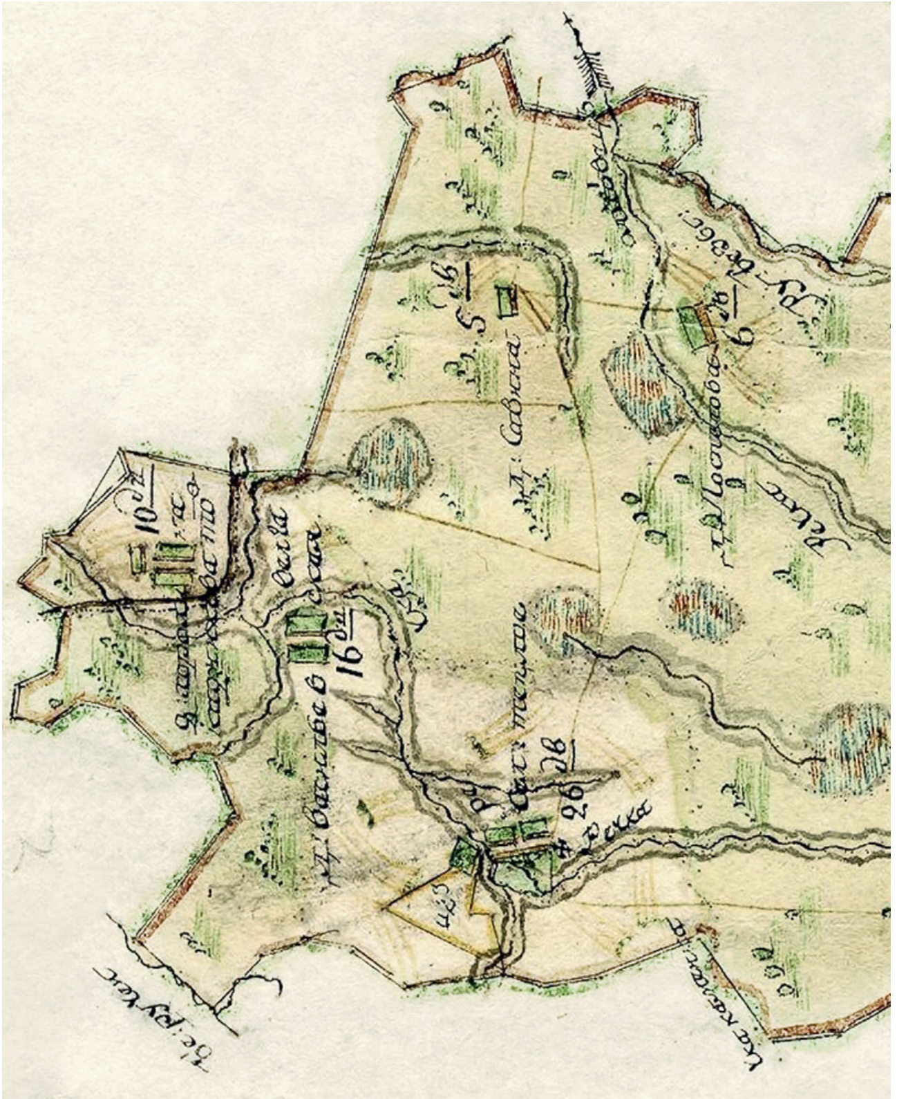
3-1. Село Теплое на карте плана Генерального межевания Воскресенского уезда 1778-1796 гг.