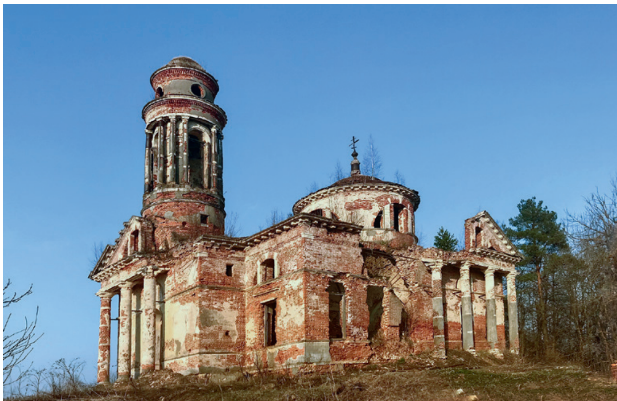
72. Знаменская церковь. Вид с юго-запада. 2021 г.