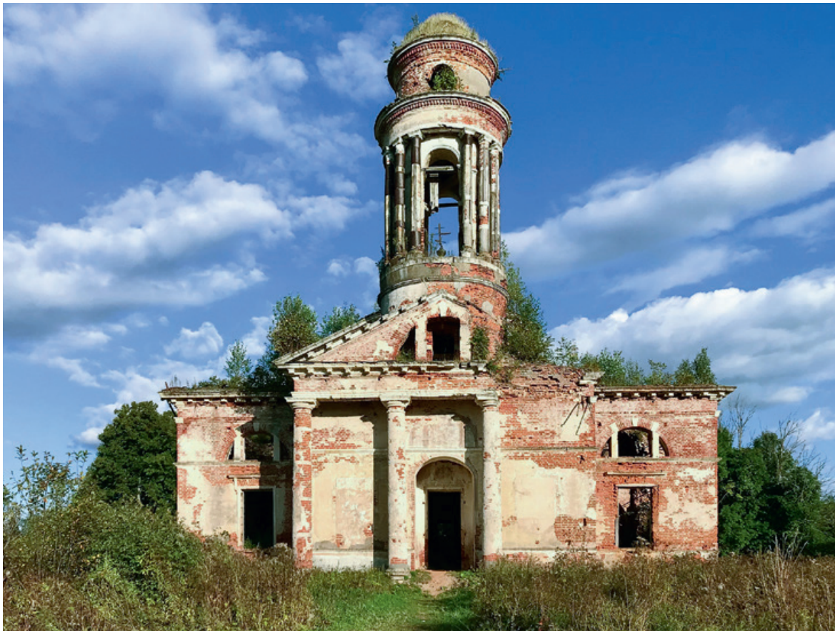
71. Знаменская церковь. Вид с запада. 2020 г.