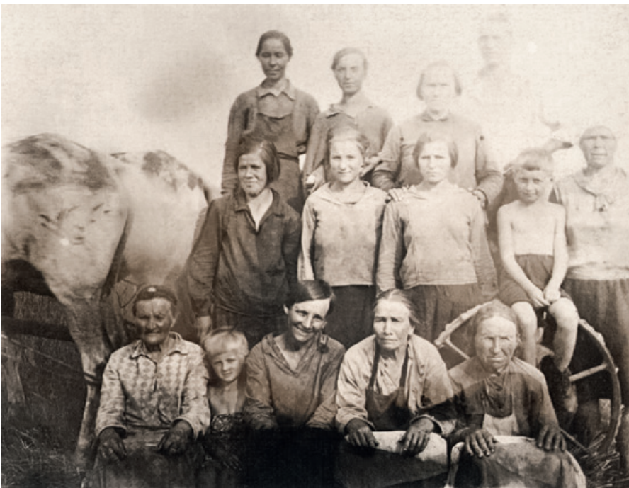
110. Жители Теплого. 1930-е гг.