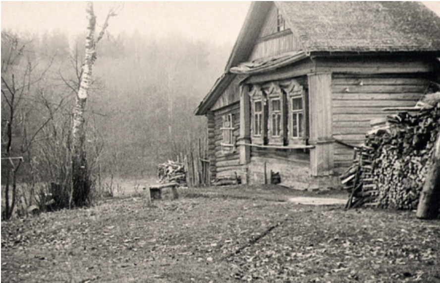
108. Дом в Теплом рядом с церковью. 1950-е гг.