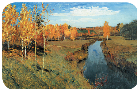
А это карти́на изве́стного ру́сского художника Исаа́ка Левита́на.