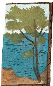
Это карти́на художника Васи́.