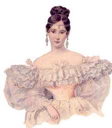
А это портре́т жены́ Пу́шкина Ната́льи Гонча́ровой.