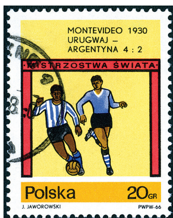
Первый чемпионат мира по футболу. Июль 1930 г.