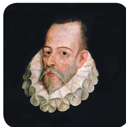
Мигель де Сервантес