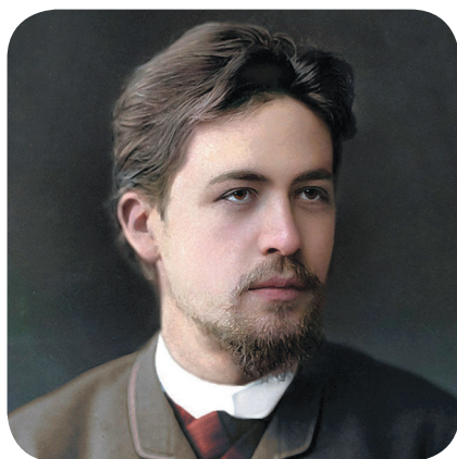
А. П. Чехов