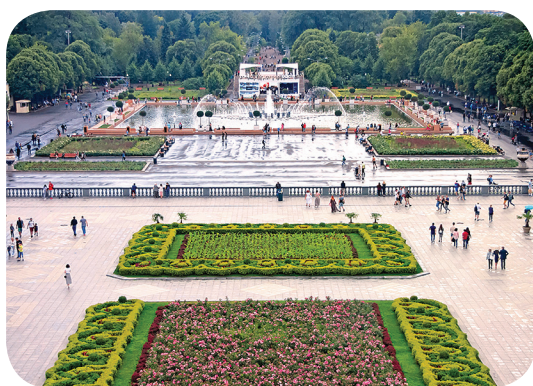
Центра́льный парк культу́ры и о́тдыха и́мени Го́рького