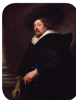
Это автопортре́т знамени́того голла́ндского художника семна́дцатого ве́ка Ру́бенса.