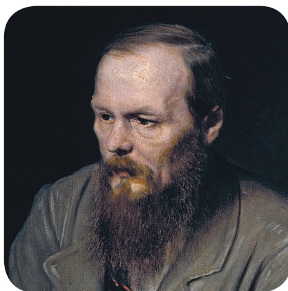
Ф. М. Достоевский