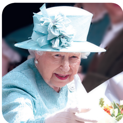
королева Елизавета II