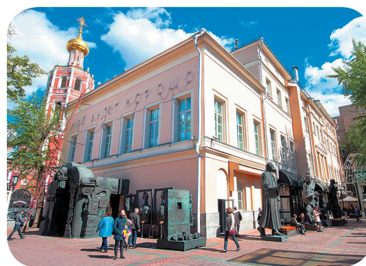
Моско́вский музе́й совреме́нного иску́ства