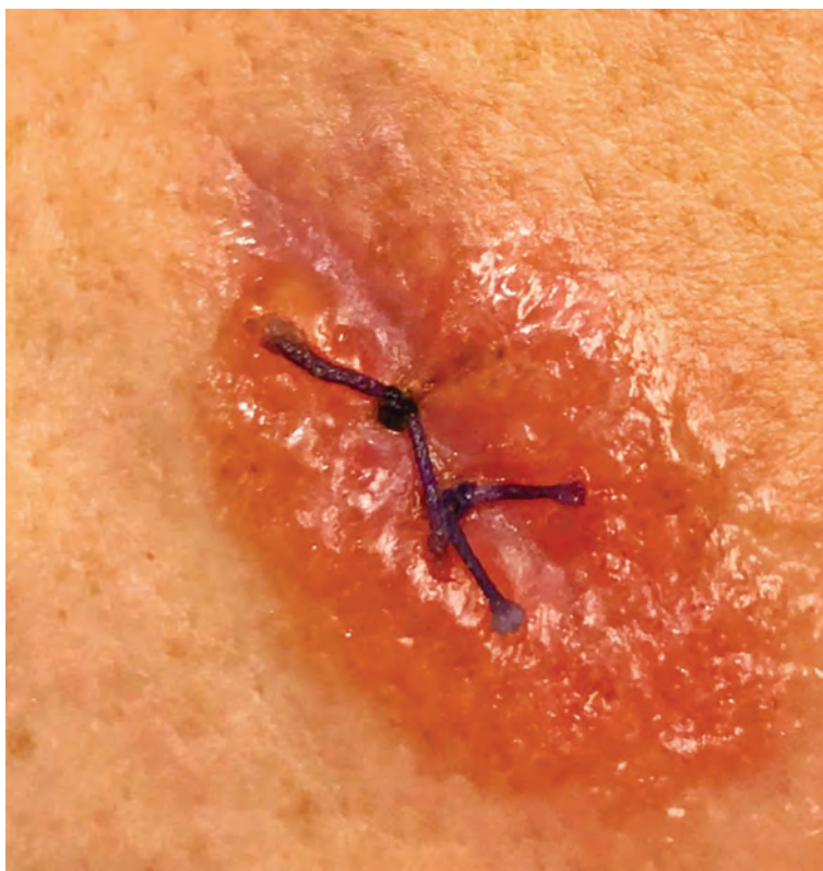
Рис. 1.4. Дерматит аллергический (наружное применение Бетадина ® , основа — повидон-йод)