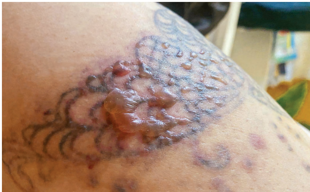
Рис. 1.6. Простой контактный дерматит