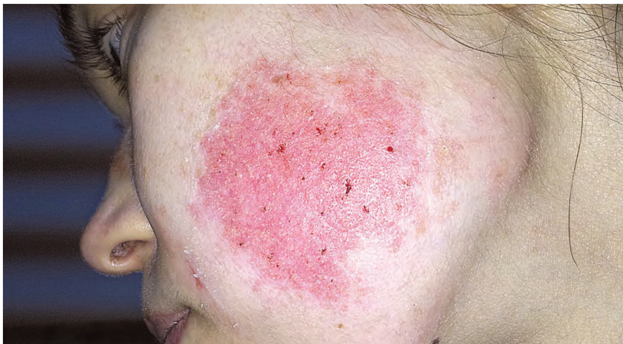
Рис. 1.1. Дерматит аллергический медикаментозный