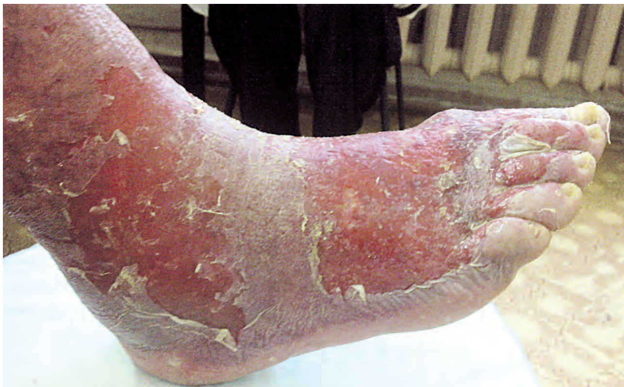
Рис. 1.9. Дерматит простой термический (кипяток)