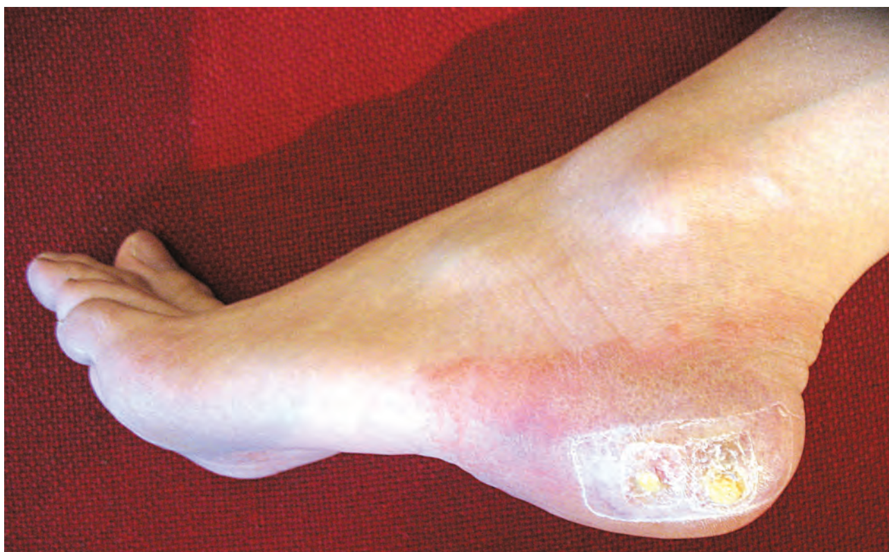
Рис. 1.2. Дерматит аллергический (применение салипода)