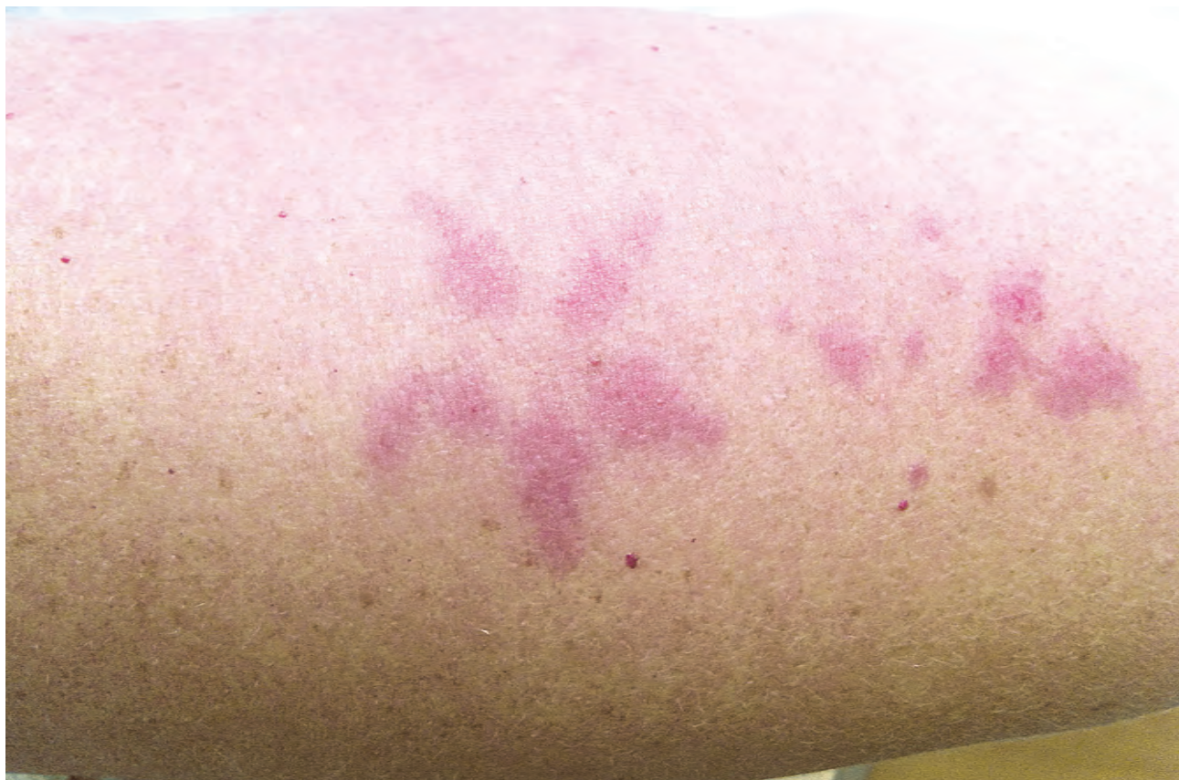
Рис. 1.5. Дерматит простой (после выведения татуировки лазером)