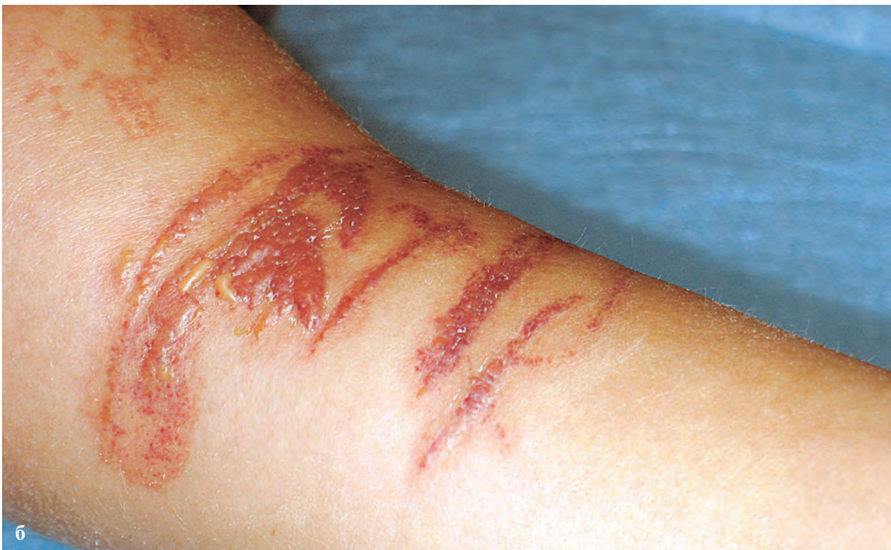
Рис. 1.7. а, б. Дерматит купальщиков (контакт с медузой)