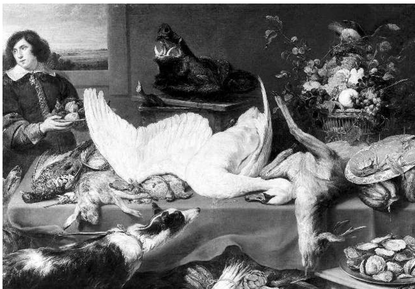
Франс Снейдерс. Натюрморт с лебедем. 1640-е. ГМИИ им. А.С. Пушкина