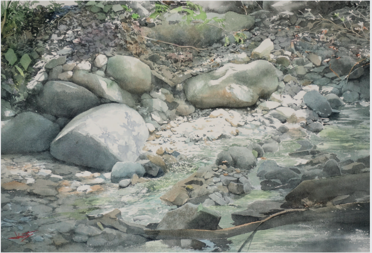
КАМНИ И ВОДА