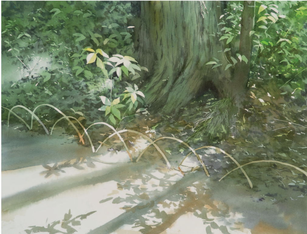
■ СВЕТ НА ТРОПЕ 29,0 × 39,0 см