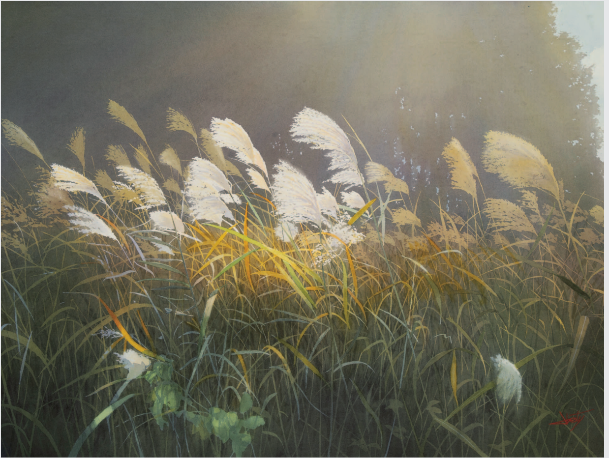
НА ВЕТРУ В ЛУЧАХ СВЕТА