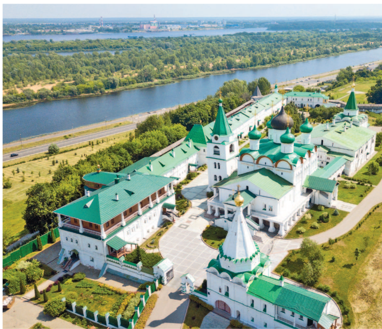
Печерский Вознесенский монастырь

Вечер. Завершите день прогулкой по Рождественской улице (▷38) и ужином в ресторане «Безухов» (▷59).