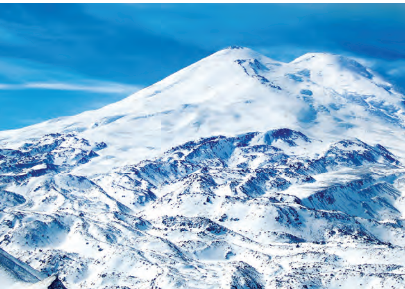
Величественный Эльбрус. Кабардино-Балкарская Республика

К территории заповедника примыкает обширный Национальный парк «Приэльбрусье» (св. 100 тыс. га) с развитой туристической инфраструктурой. Сюда приезжают любители горнолыжного спорта, альпинизма, пеше-