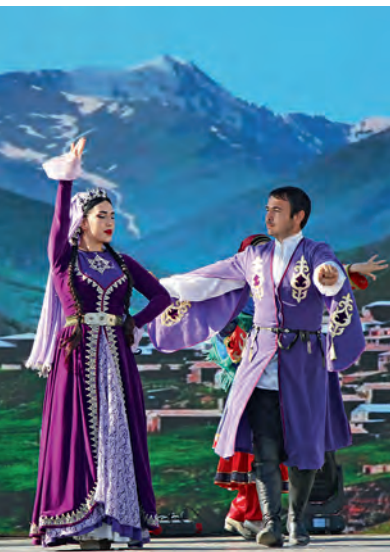
Зажигательный танец, Республика Дагестан

Июль. Фестиваль народных промыслов и ремесел (Акушинский и Дахада-