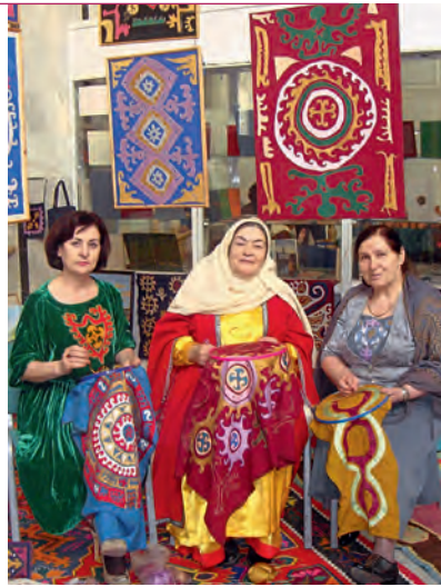
Мастерицы кайтагской вышивки

Особенно славились своими коврами южные районы Дагестана – Дербентский, Табасаранский, Хивский, Ахтынский, а также Чечня и Ингушетия. Наиболее распространенными видами безворсовых ковров являлись лезгинский сумах ( гам ), аварский двусторонний давагин со сложным симметричным орнаментом, кумыкский дум . Паласы с простым ленточным или узорчатым декором использовались для покрытия полов. Популярными ви-