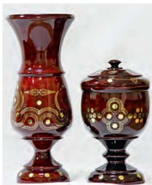
Шедевры унцукульских мастеров

Во всех горных районах было развито овцеводство, что позволяло развивать ткачество и изготавливать высококачественные шерсть, сукно и овчину. Сукно использовали, например, для изготовления повседневной мужской и женской одежды, а также черкесок – национальной одежды многих народов Северного Кавказа. Самые дорогие черкески украшались золотым или серебряным шитьем. Из шерсти валяли войлок, из которого делали бурки – незаменимые в суровых горных условиях теплые плащ-накидки для всадников, пастухов и охотников. Издревле лучшими считались бурки, сделанные кабардинскими мастерами. С традициями войлоковаления североосетинских мастеров можно ознакомиться в Доме войлока (г. Владикавказ, Северная Осетия).