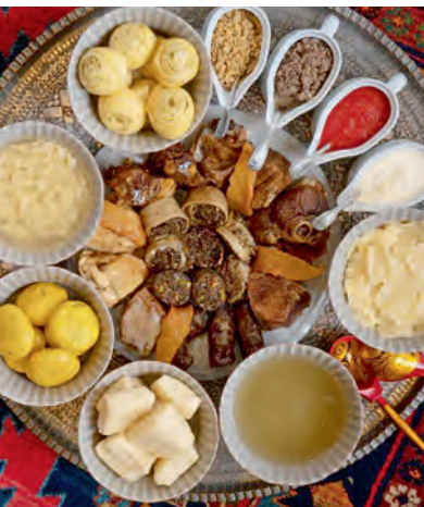
Все виды дагестанского хинкала

Одно из основных и самых популярных главных блюд кухни многих народов – отварное мясо с галушками, сваренными в мясном бульоне. В Дагестане галушки называются хинкал . По имени этого важного составляющего называют и весь комплекс подаваемых вместе с ним на стол отдельных блюд: бульон со специями, мясо, соус. Хинкал обмакивают в соус, запивают бульоном, потом едят мясо. Аналогичное главное чеченское национальное блюдо называется