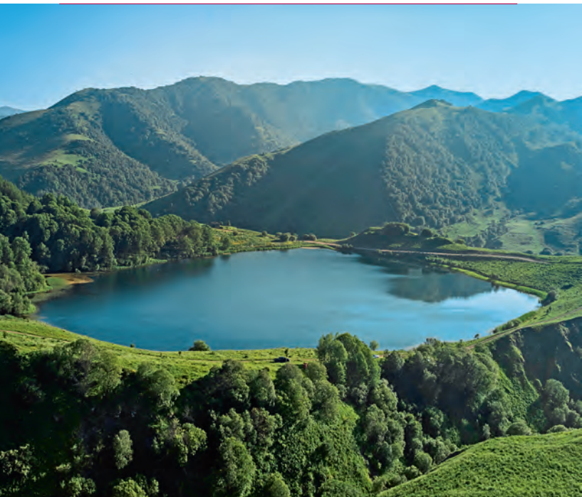
Озеро Кезеной-Ам. Чеченская Республика

Для горно-лесной зоны (пояса предгорий, высоты до 2200 м) характерны средние температуры: летом – +18–22 °С, зимой – -1 °С – -12 °С. Среднегодовое количество осадков – 600–900 мм.