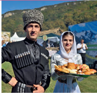
Праздник сыра. Республика Адыгея

Октябрь. Межрегиональный фестиваль адыго-абхазских театров (г. Майкоп, Адыгея). Международный фестиваль русских театров Северного Кавказа и стран Черноморско-Каспийского региона (г. Махачкала, Дагестан). Фольклорно-этнографический праздник уборки урожая «Дошо гуйре» (г. Назрань, Ингушетия). Крае-