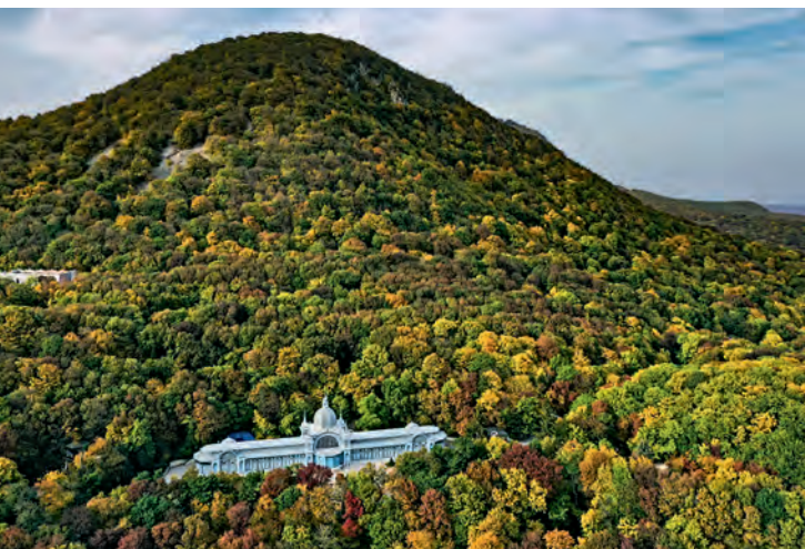
Гора Железная. Ставропольский край

Благодаря протяженному песчаному побережью Каспийского моря, в Республике Дагестан развит не только экскурсионный, но и пляжный туризм. Желающие получить санаторно-курортное лечение выбирают санаторий «Каспий», на берегу моря в 35 км южнее Махачкалы. Тысячи туристов приезжают в один из древнейших городов мира Дербент. И зимой, и летом любителей активного отдыха в горах приглашает спортивный курорт «Чиндирчero», расположенный на высоте 2500 м над у. м. В высокогорном Гунибском районе, на высоте 1700 м, работает детский санаторий «Гуниб», а в южном Ахтынском районе, на высоте 1100 м, принимает детей санаторий «Ахты».