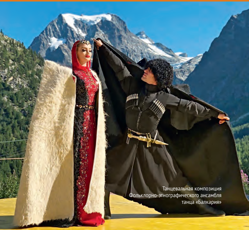
Танцевальная композиция Фольклорно-этнографического ансамбля танца «Балкария»