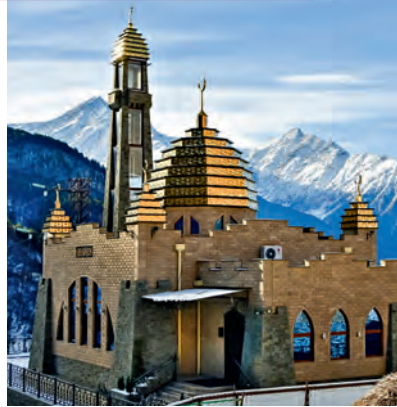
Мечеть в поселке Гули Джейрахского района. Республика Ингушетия

В 2018 г. открылся первый в Чеченской Республике всесезонный горнолыжный курорт «Ведучи». А чуть раньше на берегу одноименного озера – жемчужины Кавказа (1860 м) открылся спортивно-туристический комплекс «Кезеной-Ам». На западе республики, близ границы с Ингушетией принимает отдыхающих курорт-санаторий «Серноводск-Кавказский».