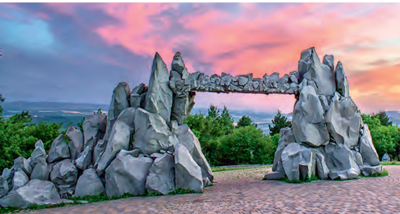
Ворота Любви. Пятигорск

На равнинах господствует влажный или засушливый умеренно-континентальный климат, как правило, с ранней весной, продолжительным летом с большим количеством солнечных дней, теплой осенью и короткой зимой с небольшим и неустойчивым снежным покровом. Температура воздуха летом – +20–26 °С, но подчас до +40 °С (конец июля – август), зимой – +1 – –8 °С. Моря в конце июля – августе прогреваются до +28 °С.