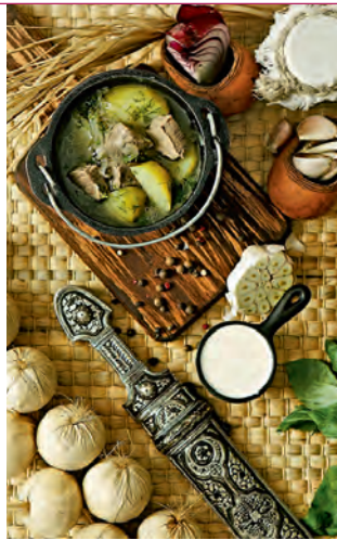
Национальный чеченский мясной суп (чорпа)

А на Ставрополье туристам предложат отведать блюда казачьей кухни: борщ, окрошку, уху, рыбный суп кулеш , вареники, гуляш, блины, шашлыки, кисели, небольшие пончики бурсаки , нардек – арбузный мед.