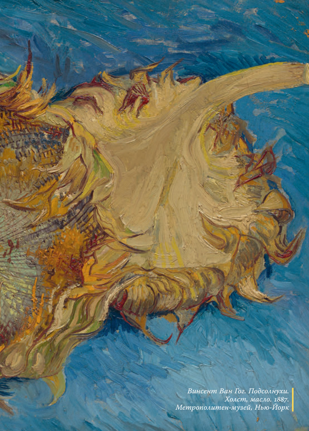
Винсент Ван Гог. Подсолнухи. Холст, масло. 1887. Метрополитен-музей, Нью-Йорк