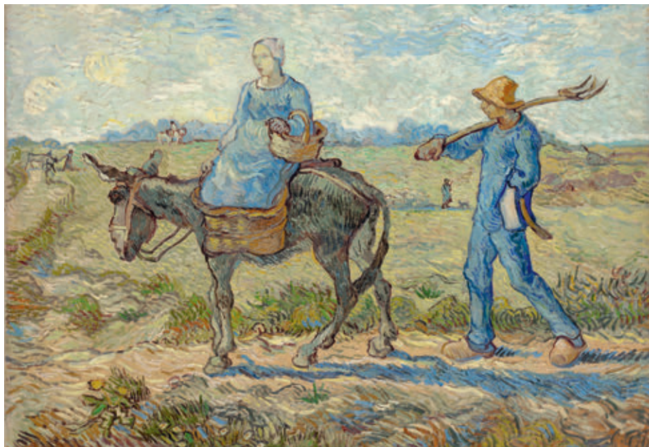
Винсент Ван Гог. Утро. Отправление на работу (подражание Милле). Холст, масло. 1890. Собрание Государственного Эрмитажа

лее характерны, чем в другом этюде. Я попытался запечатлеть в картине тот знойный час, когда порхают зеленые бронзовки и скачут кузнечики.