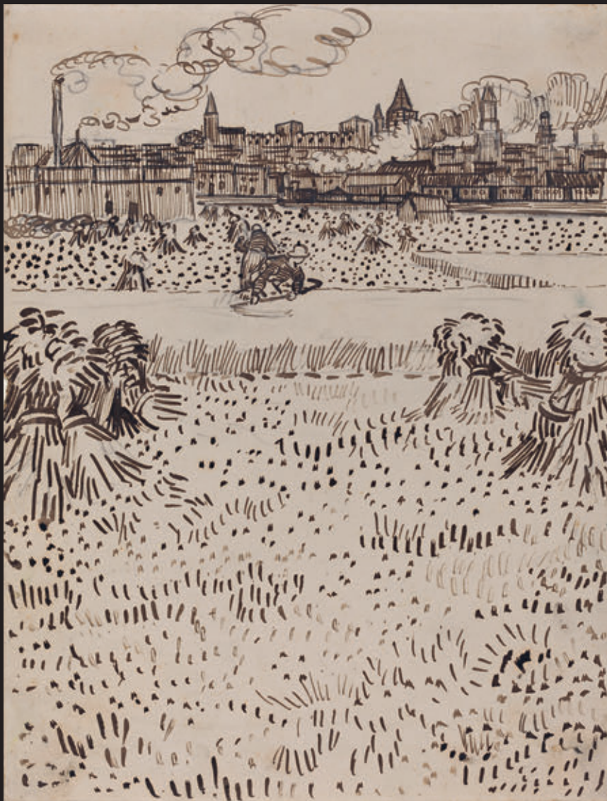
Винсент Ван Гог. Урожай. Бумага, перо, коричневые чернила, графит. 1888. Национальная галерея искусства, Вашингтон