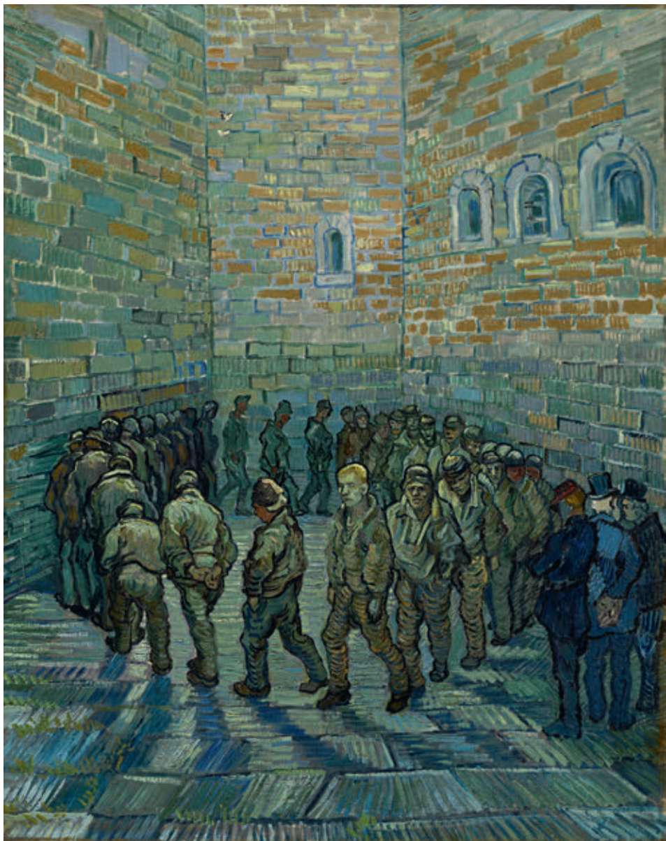
Винсент Ван Гог. Прогулка заключенных. Холст, масло. Февраль 1890. ГМИИ им. А. С. Пушкина, Москва