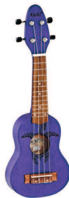
Сопранино Ortega K1 Keika

Сопранино – очень маленький вид укулеле, ее длина составляет всего 40 см. Я читала, что существуют варианты еще меньше – сопраниссимо и наноукулеле (наноукулеле делает человек по имени Энди в своей локальной мастерской Andy's Ukuleles. На практике такой размер подойдет лишь новорожденным, но тем не менее он считается настоящим музыкальным инструментом). На российском музыкальном рынке данный тип почти не встретить, я знаю лишь один бренд – Ortega, – который выпустил укулеле данного размера (модель Ortega K1 keiki). У такого вида лишь двенадцать ладов, и то рабочие из них только первые пять – на них можно зажать аккорды, на остальных – палец зажмет сразу два лада. Сопранино меньше сопрано на три с половиной лада. Это довольно сильно ощущается, и, чтобы нормально звучать, ее настраивают на два полутона выше от стандартного строя – A D F# B (а типичным строем принято считать G C E A). Схемы аккордов абсолютно такие же, как и на сопрано,