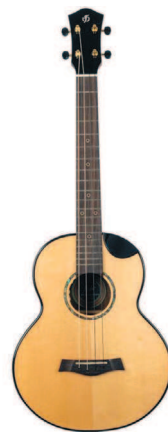
Баритон FLight Aurora EQ-A