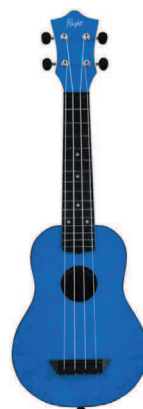
Сопрано Flight tus-65 sapphire

Концерт считается золотым укулеле-стандартом. Если планируешь больше музицировать дома, а активный отдых не для тебя, то между сопрано и концертом однозначно стоит выбрать концерт. Даже когда я вела переговоры по поводу выпуска подписной укулеле, я без раздумий решила, что она будет концерт. По сравнению с сопрано у концерта больше ладов, его удобнее держать и зажимать аккорды. Тем более что у концерта небольшая разница в стоимости (рублей 300–400) относительно сопрано. Как по мне, лучше чуть переплатить за комфорт и потом не мучиться, что инструмент неудобен. На моей практике уже много раз бывало, что будущий ученик, не посоветовавшись и не изучив вопрос, покупал сопрано, не учитывая