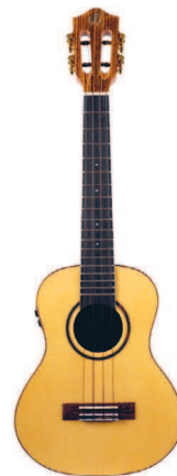
Тенор Flight Sophia TE Soundwave

Укулеле такого вида довольно мало распространена по сравнению с остальными размерами. Возможно, просто нужно дать время, чтобы настал ее звездный час.