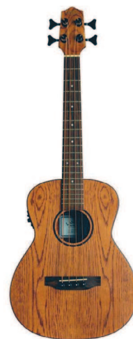
Бас Ianikai OA-EBU

Данный инструмент чуть больше баса, примерно на пять сантиметров, и у него не будет разграничений по ладам, то есть это безладовый инструмент. Максимально специфическая и редкая штука, так как без музыкальной подготовки невозможно попасть на нужную ноту.