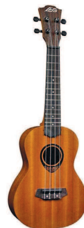
LAG TKG-10C (дерево)