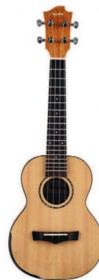
Концерт Veston KUC-500 SP/MAH