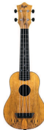
Flight TUS-55 MANGO (пластик)