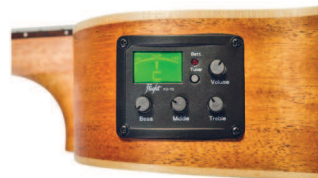
Тюнер, встроенный в инструмент