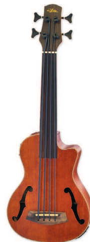
Контрабас Aria AUB CE