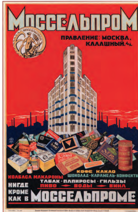
Плакат 1926 года