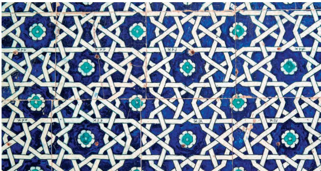
Среднеазиатская майолика — отдельный жанр искусства

ного производства в республике тогда не было. Строили его на добровольные пожертвования трудящихся Востока. Многие работы проводились во время субботников.