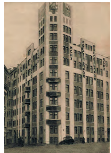
Моссельпром в 1930-е годы

ЗДАНИЕ МОССЕЛЬПРОМА НАЗЫВАЮТ ПЕРВЫМ СОВЕТСКИМ НЕБОСКРЕБОМ. ПОЯВИТЬСЯ ОНО МОГЛО ЗАДОЛГО ДО РЕВОЛЮЦИИ 1917 ГОДА. НО, ВИДИМО, ЕГО ВРЕМЯ ПРИШЛО ИМЕННО В СЕРЕДИНЕ РЕВОЛЮЦИОННЫХ 1920-Х.