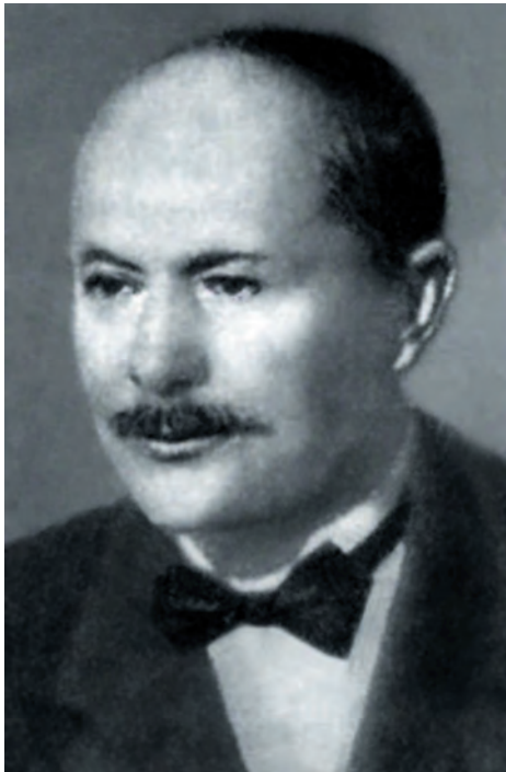
Артур Лолейт — автор фирменной башни