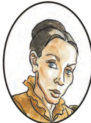
Княгиня Мария Болконская