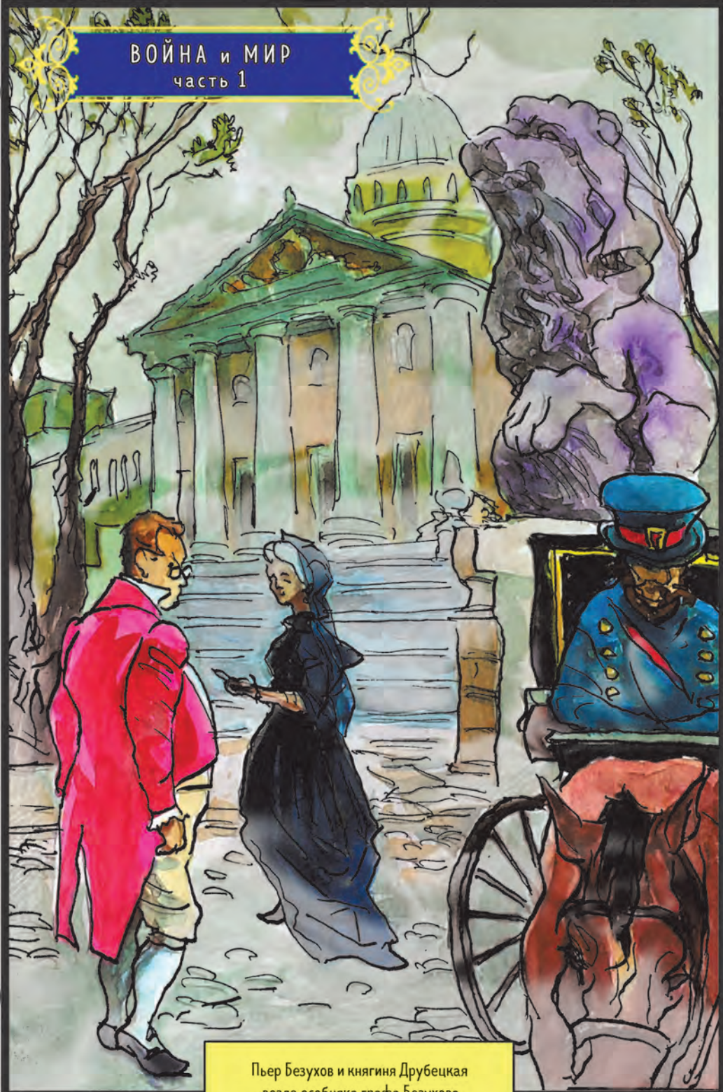
Пьер Безухов и княгиня Друбецкая возле особняка графа Безухова