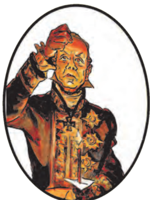
Князь Василий Курагин