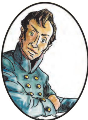
Князь Андрей Болконский