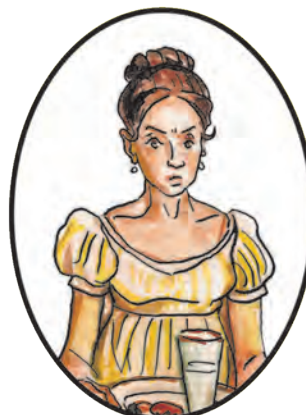
Соня, племянница Ростовых