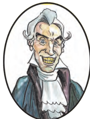
Князь Николай Андреевич Болконский