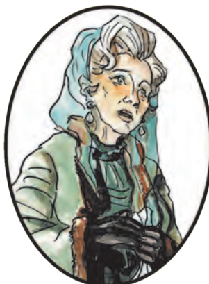
Княгиня Анна Друбецкая