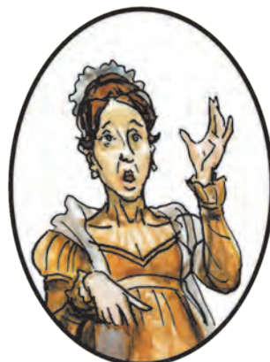
Княгиня Лиза Болконская