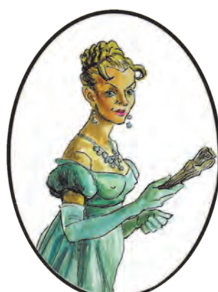
Княжна Элен Курагина