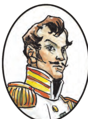
Князь Анатолий Курагин