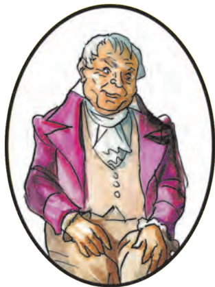
Граф Илья Ростов