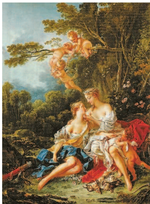
Ф. Буше. Юпитер и Каллисто. 1744 г. Государственный музей изобразительных искусств им. А. С. Пушкина, Москва

В богатом художественном наследии Античности каждая эпоха черпала свои образы и идеалы, выражая в них собственное отношение к жизни. Сегодня древние боги, герои, фантастические существа спокойно и величественно взирают на нас с полотен знаменитых художников. Они общаются с нами со страниц художественной литературы, передают нам свои чувства и мысли на языке танца, в ритмах музыкальных произведений. Герои античных мифов, воплощённые в камне и бронзе,