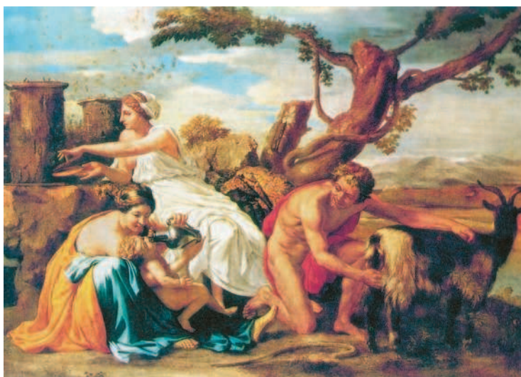
Н. Пуссен. Детство Юпитера. 1637 г. Картинная галерея колледжа, Далич

дан на воспитание лесным божествам на остров Крит. Французский художник Никола Пуссен (1594—1665) запечатлел этот сюжет в картине « Детство Юпитера ». Персонажи картины свободно располагаются среди живописных деревьев и скал. Одна из нимф лёгким движением, напоминающим танец, собирает мёд из древесного дупла. Согласно легенде, младенец Зевс был вскормлен козой Амалфеей. После смерти своей кормилицы Зевс в знак признательности вознёс её на небо, превратив в созвездие Возничего. Шкуру козы он превратил в щит (эгиду) — знак высшей божественной власти, а рог Амалфеи — в рог изобилия, обладавший волшебным свойством давать всё, что пожелает его обладатель.