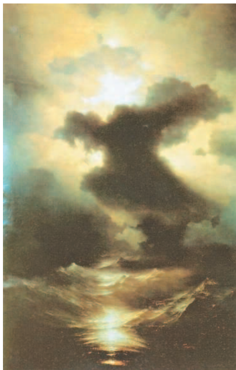
И. Айвазовский. Хаос (Сотворение мира). 1841 г. Музей армянской культуры, Венеция

4. Подумайте, какое значение и почему имеют в нашем языке такие слова и словосочетания, как ехидна , цербер , химера , сфинкс , провалиться в тартарары , рог изобилия , находиться под эгидой . Составьте собственный словарь устойчивых словосочетаний (фразеологизмов).