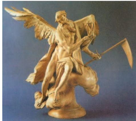
Ф. Гюнтер. Кронос. 1765—1770 гг. Баварский национальный музей, Мюнхен

Благодаря хитрости матери, сумевшей подсунуть мужу вместо ребёнка спелёнутый камень, удалось спастись одному из сыновей — Зевсу. Младенец был от-