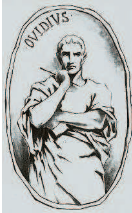
Обложка книги Овидия «Метаморфозы»

12 тысячах стихов. Равной ей нет во всей античной литературе, а поэтому в дальнейшем на страницах нашего учебника большинство примеров будет взято именно из неё. Следует также назвать «Энеиду» Вергилия, труды историка Геродота и археолога Павсания. В большинстве названных произведений созданы яркие картины, увлекательные описания, живо и легко запоминающиеся образы и сюжеты.