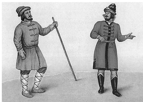
Азям и кафтан

АЗБУКА ж. — алфавит, абевега, стар. буквица; собрание в порядке всех письмен, букв, какой-либо грамоты; азбука славянская — собственно буквица, кириллица, для отличия от глаголицы, вероятно, придуманной папистами; || учебник грамоты, букварь; || начальные основания какой-либо науки. Азбуку учат, во всю избу кричат. || Роспись, оглавление, указатель в азбучном порядке, алфавит. Азбука имен. Азбучник м. -ница ж. — учебник азбуки, начал грамоты. Азбукóвина ж. — чужие, нерусские, незнакомые письмена; уродливые, ломаные.