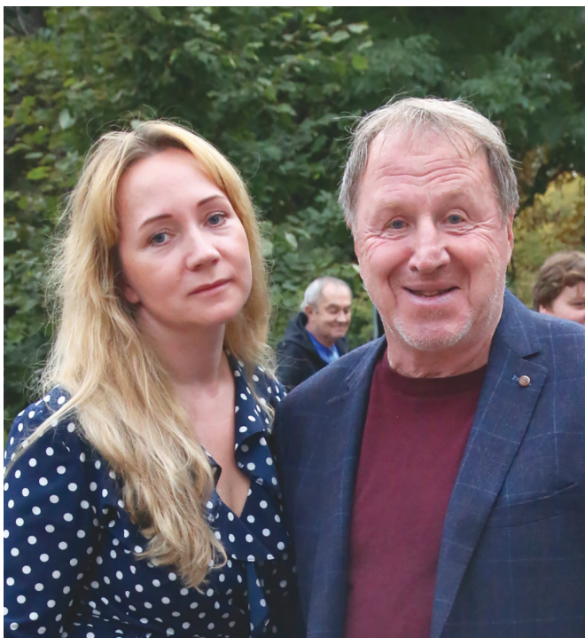
Владимир Стеклов – разница в возрасте 33 года

ЗРЕЛЫЕ АРТИСТЫ ЧАСТО ЖЕНЯТСЯ НА МОЛОДЫХ. НЕРЕДКО ЭТО У НИХ НЕ ПЕРВЫЙ БРАК. РАССКАЗЫВАЕМ О ТЕХ СЕМЬЯХ, ГДЕ ИЗВЕСТНЫЙ МУЖЧИНА ГОРАЗДО СТАРШЕ ЖЕНЫ, – И ИХ ПАРЫ СЧИТАЮТСЯ ЗА АРТИСТИЧЕСКИМИ КУЛИСАМИ ОДНИМИ ИЗ САМЫХ КРЕПКИХ.