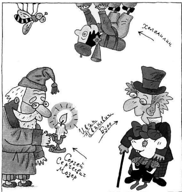
Рисунки В. Дмитриюка .....