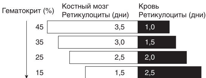
Рис. 2. Изменение длительности созревания ретикулоцитов при анемии

Нормальное количество ретикулоцитов в периферической крови здорового взрослого человека колеблется в пределах 0,2–1,2% при ручном подсчете или 0,2–2,2% при подсчете на гематологических анализаторах. Индекс продукции ретикулоцитов (RPI) изменяется при различных анемиях и является дополнительным показателем, который отражает активность клеток эритропоэза в костном мозге ( рис. 3 ).