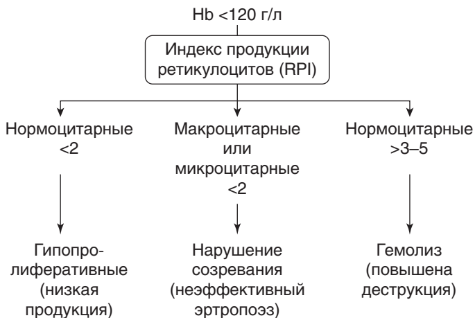
Рис. 3. Диагностическое значение индекса продукции ретикулоцитов

Нормальное количество ретикулоцитов в периферической крови здорового взрослого человека колеблется в пределах 0,2–1,2% при ручном подсчете или 0,2–2,2% при подсчете на гематологических анализаторах. Индекс продукции ретикулоцитов (RPI) изменяется при различных анемиях и является дополнительным показателем, который отражает активность клеток эритропоэза в костном мозге ( рис. 3 ).