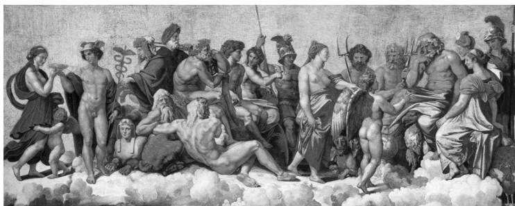
Рафаэль. Совет богов. 1510-е гг.

Слово «бог», которое обычно используется в переводах на русский язык по отношению к могущественным обитателям древних мифов, довольно условно. Каждый народ, создававший свою мифологию, называл их по-своему.