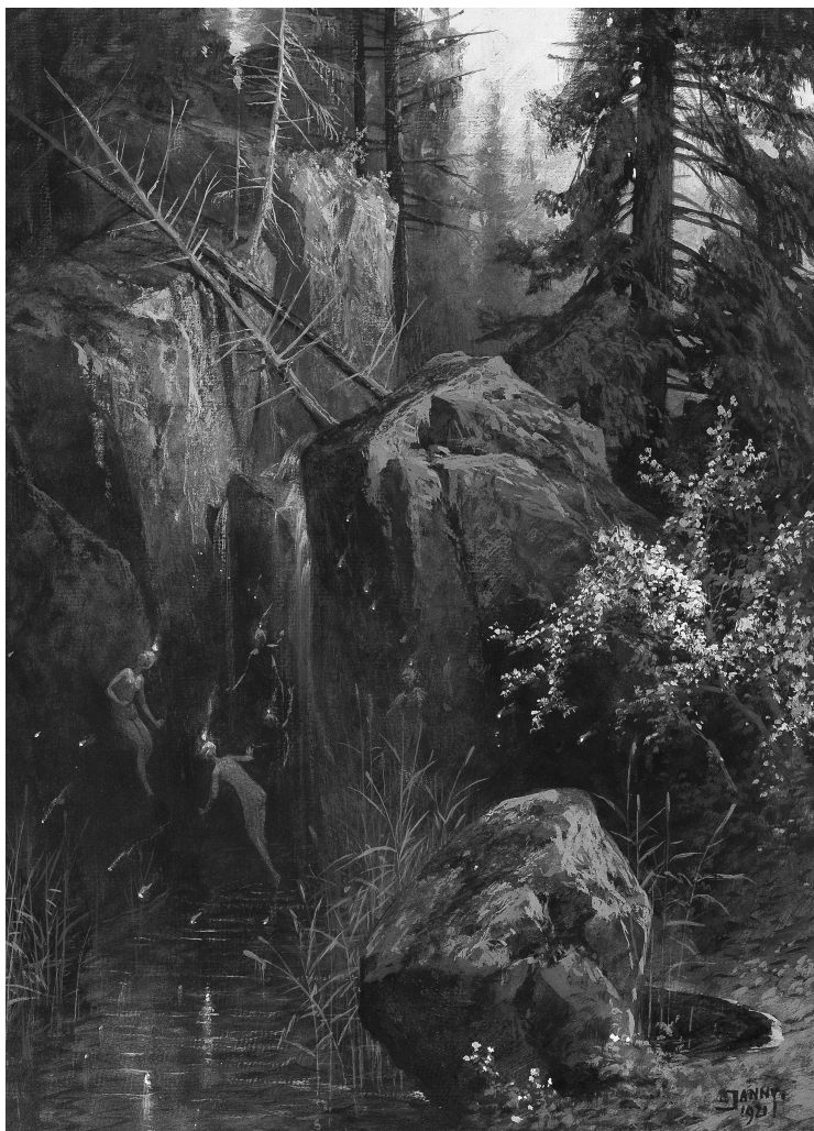
Г. Янни. Лесные нимфы. 1920 г.