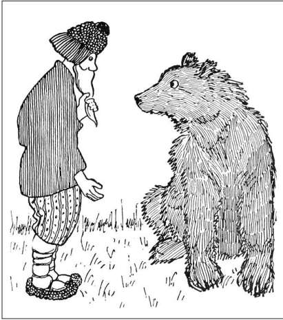
В. Каррик. Иллюстрация к сказке. 1910-е гг.

жество национальностей, рассмотреть все возможные мифы в рамках одного издания попросту невозможно.