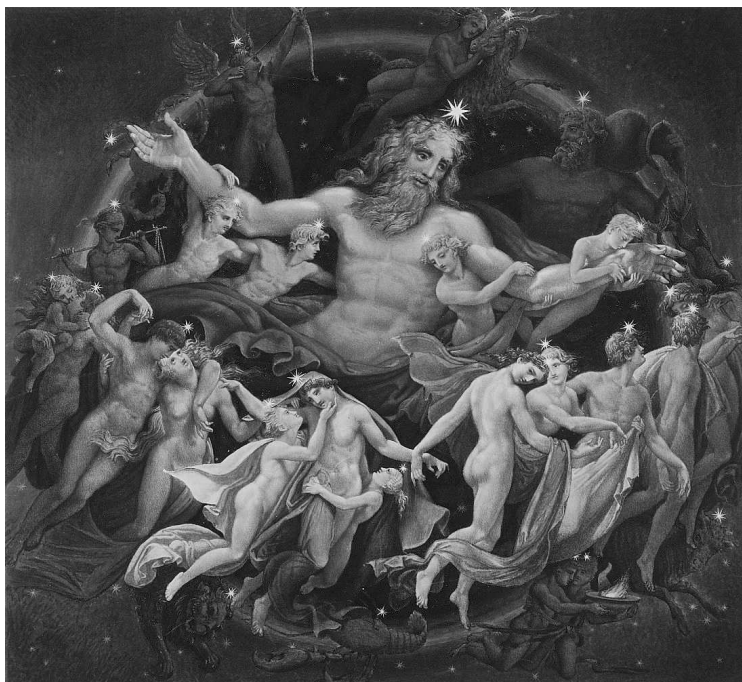
К.-Ф. Шинкель. Уран (олицетворение Неба в греческой мифологии) и танцующие вокруг него звезды. 1834 г.

До нас дошло множество древних мифов: греческие, скандинавские, китайские... Несмотря на то, что рождались они в разных уголках земного шара, у всех есть нечто общее: абсолютное большинство мифологических систем начинаются с рассказов о сотворении земли и неба, о появлении морей, суши, скал, деревьев, о зарождении людей и животных. Причем эти истории всегда прочно связаны с природными условиями, в которых проживал создавший их народ. Так,