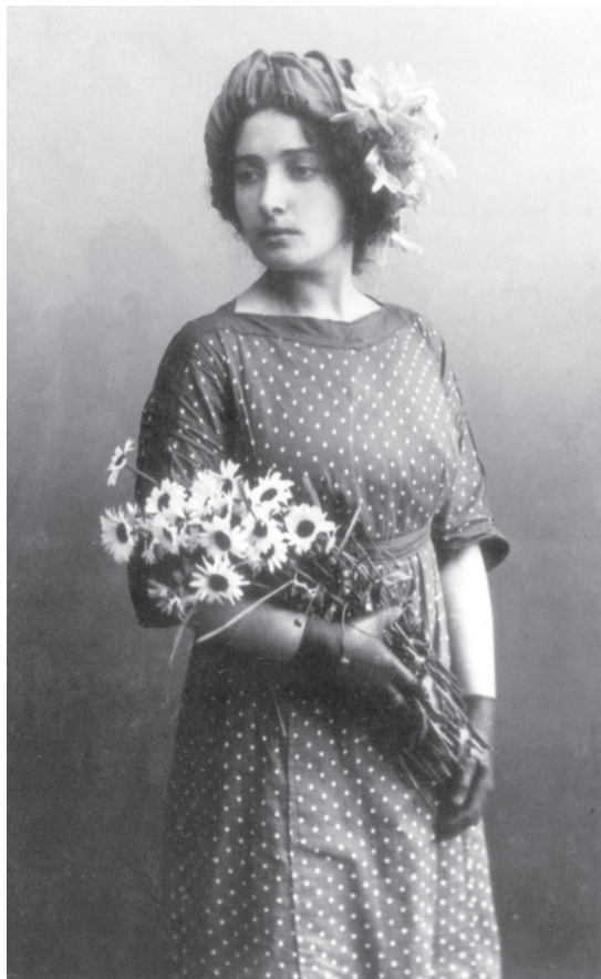
Белла Шагал (урожд. Розенфельд), 1911 г.