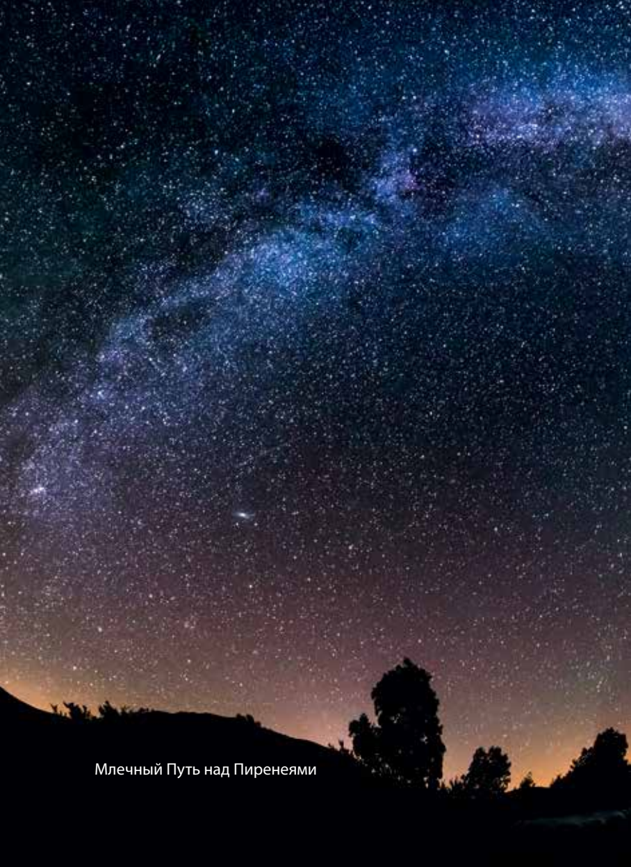
Млечный Путь над Пиренеями