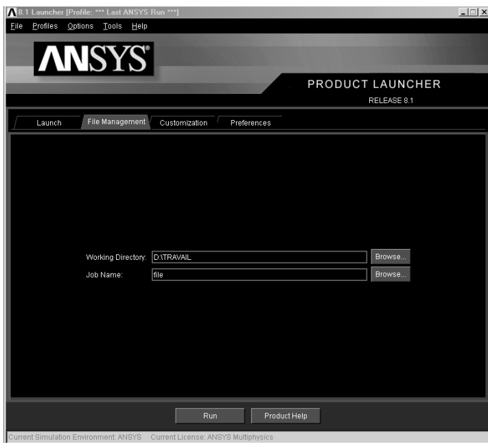
Рис. 0.2. Диалоговая панель Launcher, вкладка File Management

в себя примеры использования комплекса и в силу ряда обстоятельств отдельные ее главы являются логическим продолжением отдельных глав книги автора «ANSYS в примерах и задачах», она не является фрагментом или воспроизведением книги «ANSYS в примерах и задачах – 2».