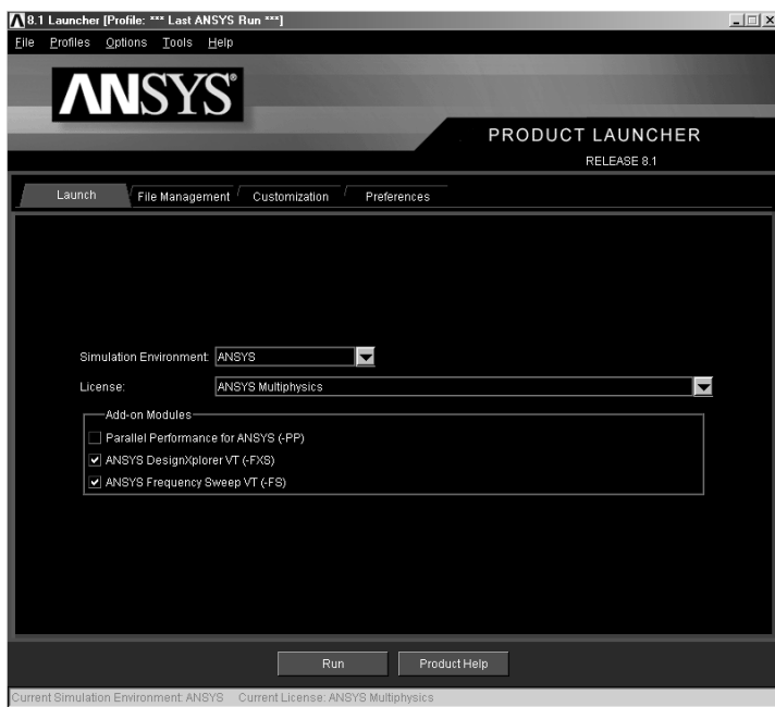
Рис. 0.1. Диалоговая панель Launcher, вкладка Launch

Вкладки Customization и Preferences можно не использовать, и заходить в них, в принципе, не стоит. В частности, в этих вкладках указываются настройки памяти (в документации к комплексу отдельно оговорено, что без особой необходимости и опыта менять их не следует), тип графического устройства и язык, который используется комплексом ANSYS. Например, по умолчанию используется американский диалект английского языка (en-us), но, в принципе, возможно применение и других языков (однако файлы для них, в том числе файл документации, в комплект поставки комплекса не входят).